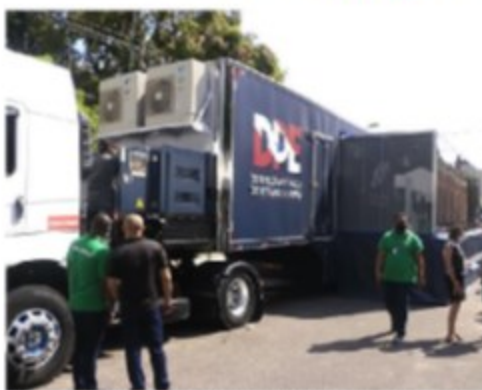
Carreta de Direitos foi inaugurada ontem, oferecendo vários serviços gratuitos à população