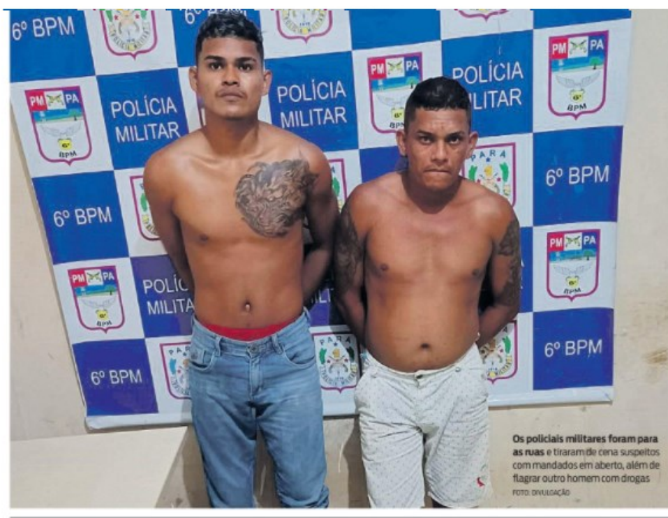
Os policiais militares foram para as ruas e tiraram de cena suspeitos com mandados em aberto, além de flagrar outro homem com drogas

Foragidos com mandado de prisões em aberto e suspeito de tráfico foram presos em Ananindeua em uma maratona de 16h tendo à frente policiais militares em várias viaturas, que fecharam o cerco contra eles