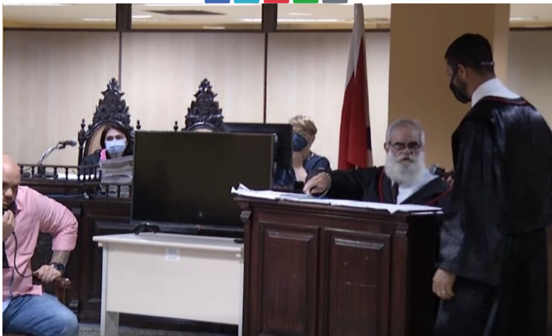
Julgamento iniciou na manhã de quarta-feira (25)