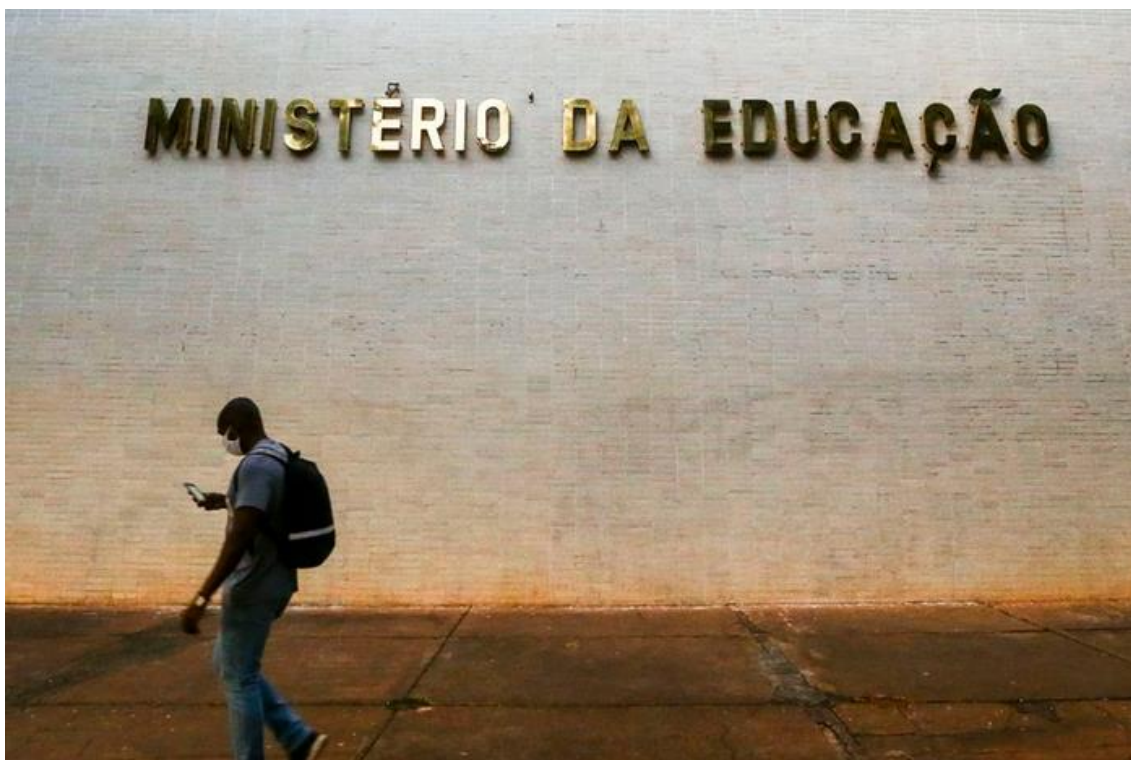
Consulta ao site do MEC pode auxiliar estudantes

Para fazer essa checagem basta acessar o site do MEC e verificar se a instituição está autorizada a ofertar o curso, no município pretendido. Também é possível encontrar informações sobre quais empresas estão autorizadas a oferecer cursos de nível superior em cada município pelo número telefônico do MEC 0800-616161.