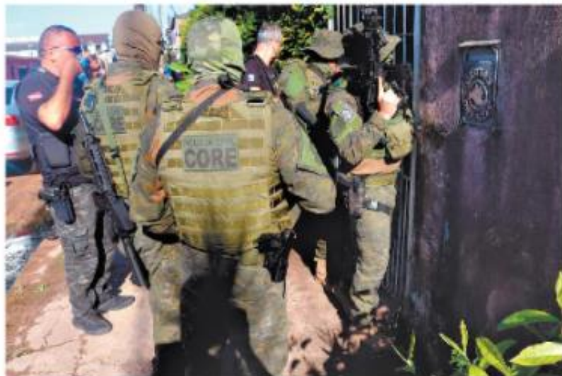
Policiais cumpriram mandados de prisão e apreensão