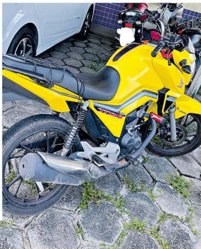
Policiais apreenderam uma motocicleta, aparelhos celulares e pedras de óxi durante a operação

Batizada de “Alforria”, ação da Polícia Civil foi realizada em Castanhal, cumpriu mandados de prisão e de busca e apreensão, e desbaratou esquema de drogas. Quatro presos fazem parte da mesma família