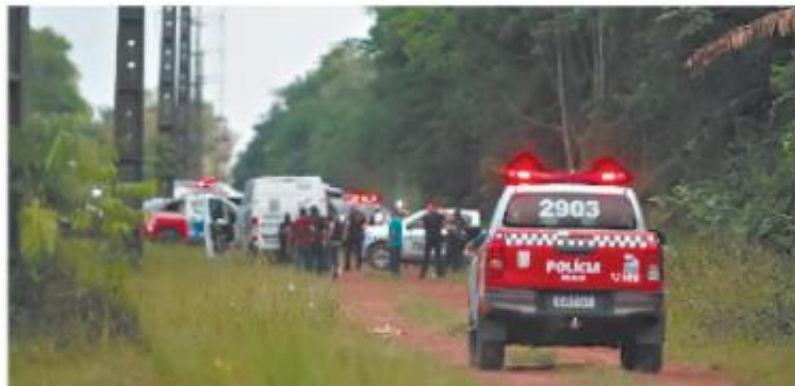
Operação Tânatos foi deflagrada na madrugada de ontem pela Polícia Civil