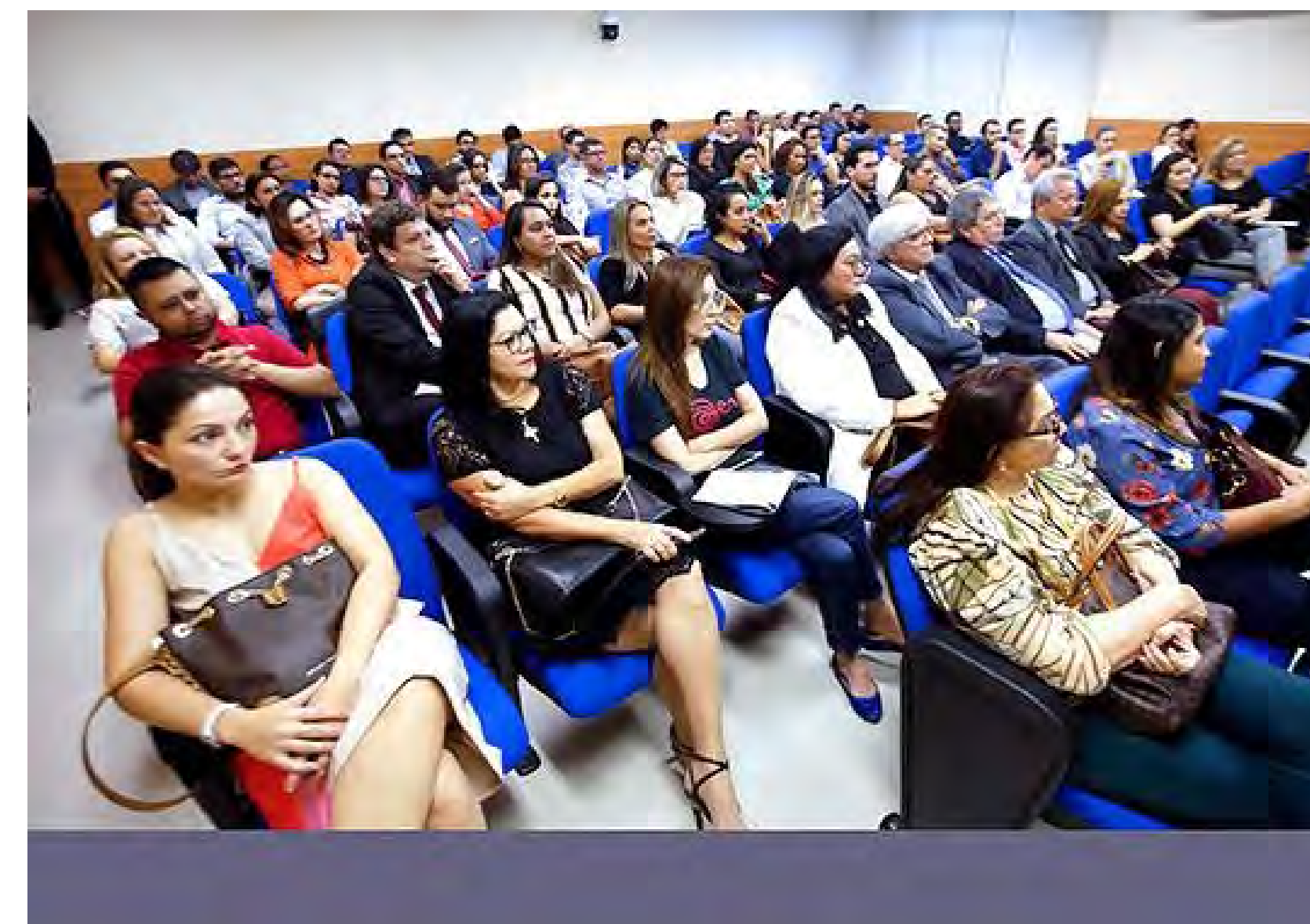
Plateia da Aula Magna 2020