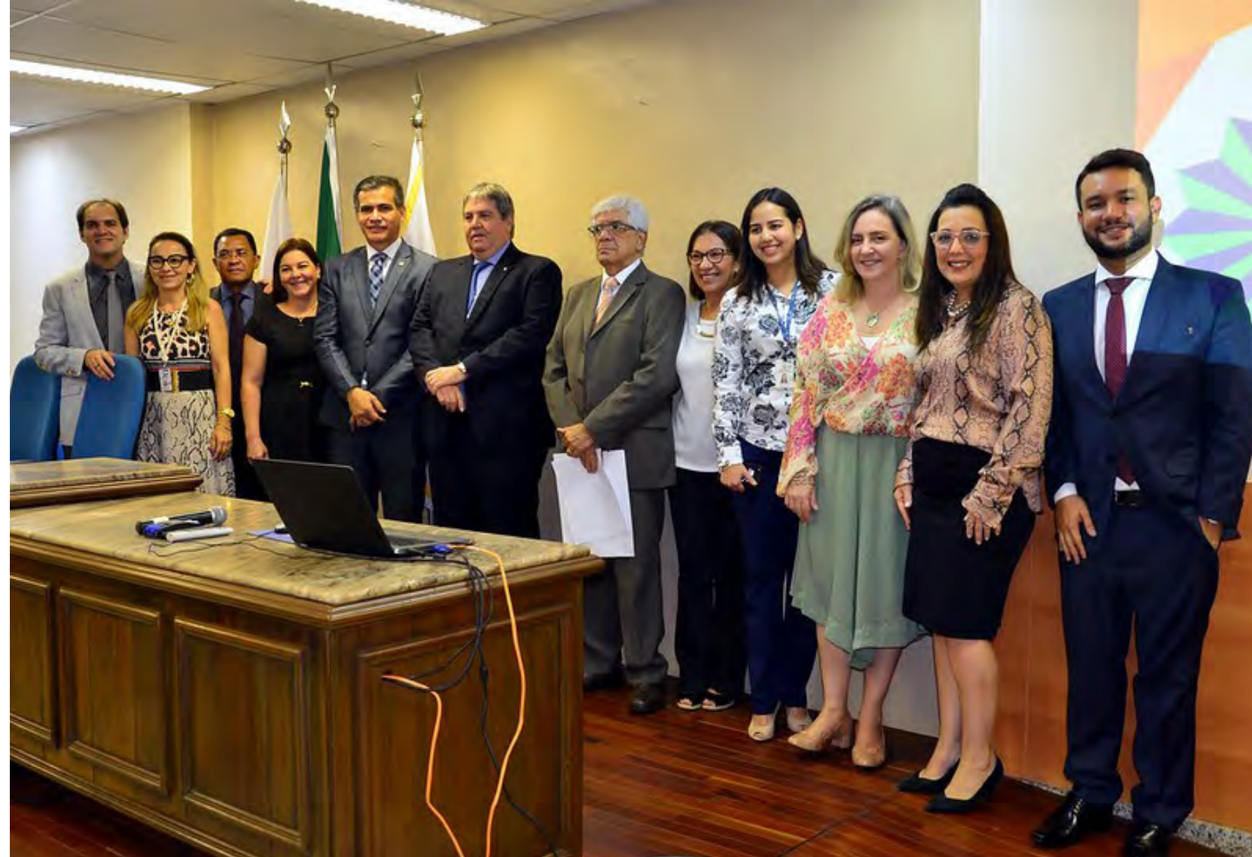
Corpo Diretivo da EJPA ao lado de convidados e da equipe técnica de servidores da EJPA durante a abertura do Curso de Pós-Graduação Gestão em Unidade Judiciária (Setembro/2019)