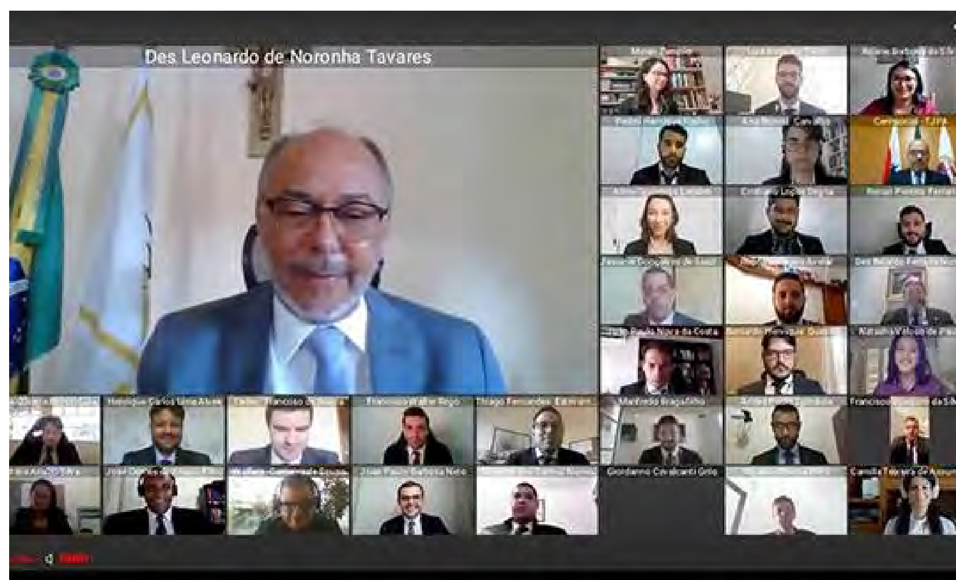
Abertura do Curso Oficial de Formação Inicial dos Juízes Substitutos – Mensagem do Desembargador Leonardo de Noronha Tavares – Presidente do TJPA

No que lhe concerne, o Curso de Formação Inicial dos novos servidores, iniciado em novembro de 2020, está formando oitenta e dois novos servidores do Poder Judiciário do Pará que foram nomeados para serem lotados em 47 Comarcas do Interior do Estado. No total, são 44 analistas judiciários das seguintes especialidades: Análise de Sistema (3), Direito (40) e Psicologia (1); 22 auxiliares judiciários e 16 oficiais de justiça.