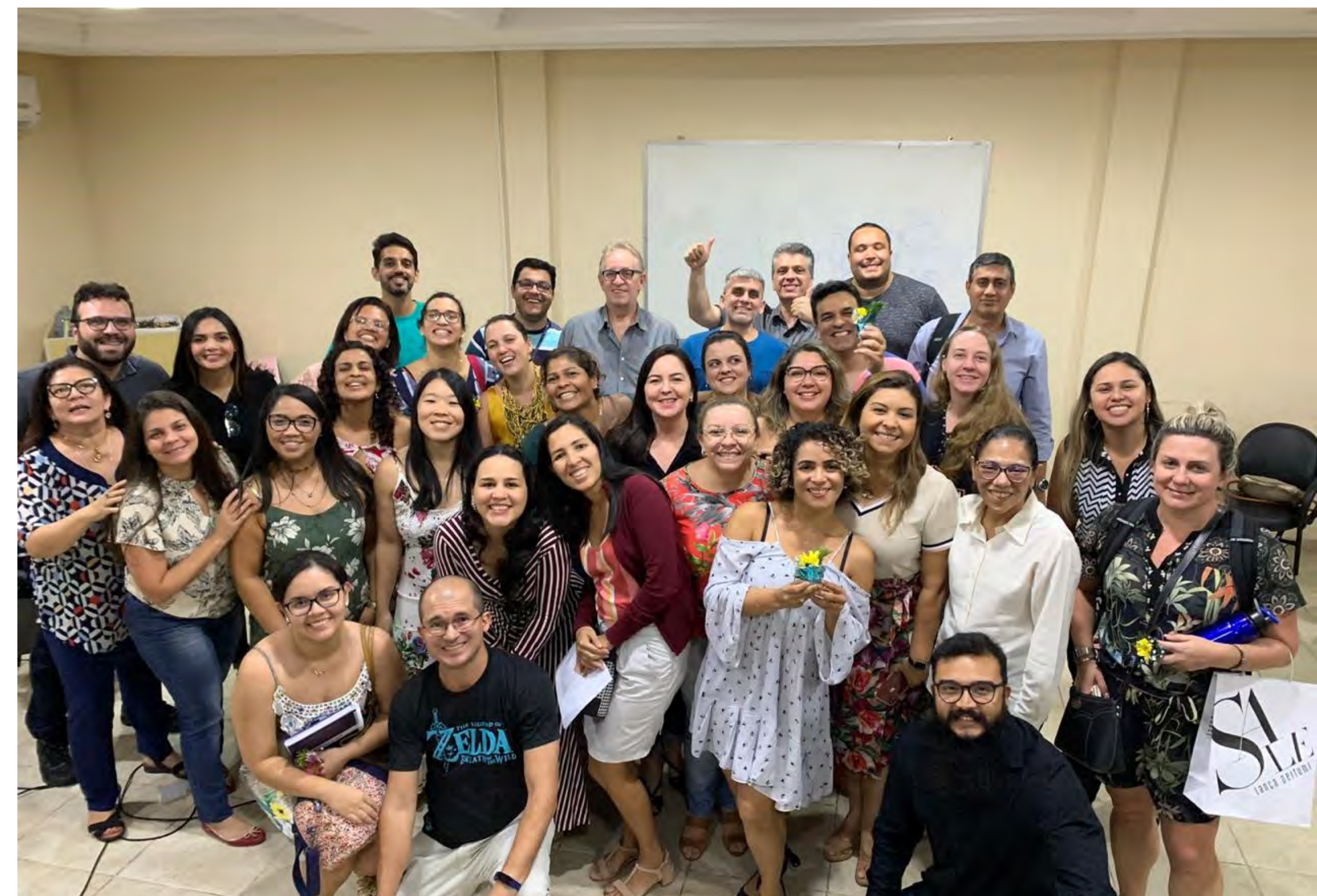
Alunos do Curso de Pós-Graduação Gestão em Unidade Judiciária durante um módulo (Setembro/2019)