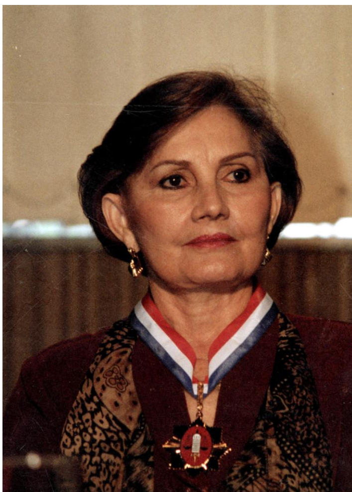
Desembargadora Climeniè Bernadette de Araújo Pontes