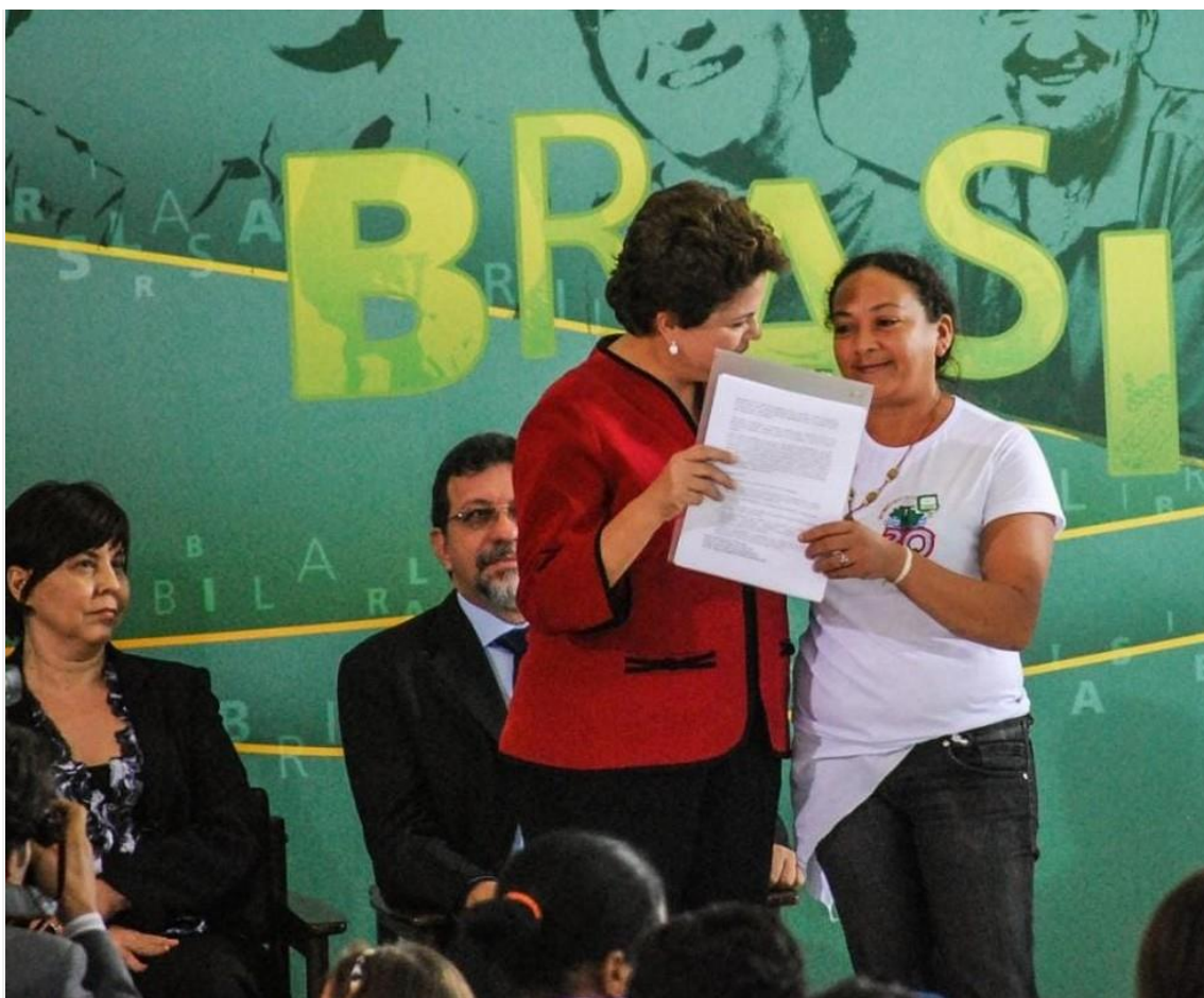
Liderança morta no Pará entregou pedido de atenção a atingidos por barragens à então presidente Dilma Rousseff