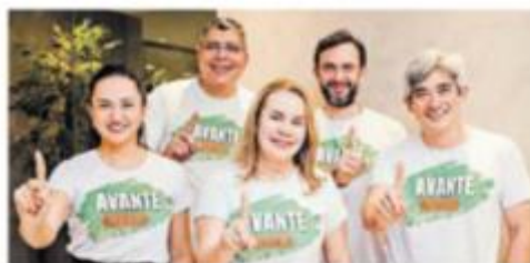
A Avante Unimed venceu a disputa pelo comando da Unimed Belém