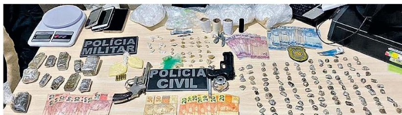
A polícia apreendeu uma grande quantidade de entorpecentes

A Polícia Civil de Cachoeira do Arari já vinha investigando o bando e após intensificação das investigações, conseguiu identificar os demais membros da organização criminosa "Comando Vermelho" que atuava no município.