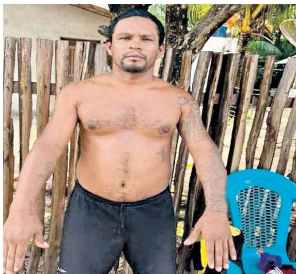
Suspeito deu uma facada mortal na companheira; ele já tinha histórico de agressões

A Polícia Civil se dirigiu ao local dos fatos para realizar o local de crime, tendo fei-