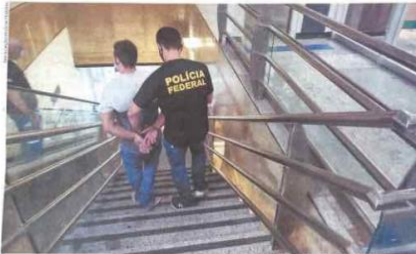
Agente da Polícia Federal conduz prisioneiro no aeroporto de Belém para entregá-lo à Polícia Civil

COROLÁRIO - De acordo com a Polícia Civil do Pará, o acusado agrediu gravemente a ex-companheira e foi detido em trabalho de cooperação entre as autoridades policiais dos dois estados