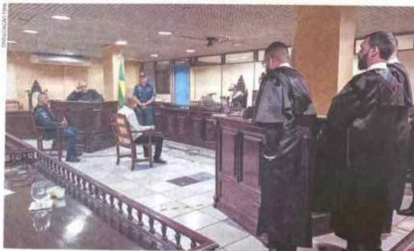
Julgamento acabou em absolvição, porém mais cinco pessoas estão na mira da Justiça pelo crime