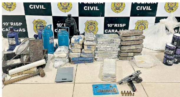
A polícia apreendeu farto material que revelava um esquema forte de traficantes

Os policiais localizaram cinco quilos de uma mistura para fabricação do entorpecente, dez potes de creatina para serem adicionados na droga, sendo encontrado, todos esses produtos e entorpecentes em um quarto