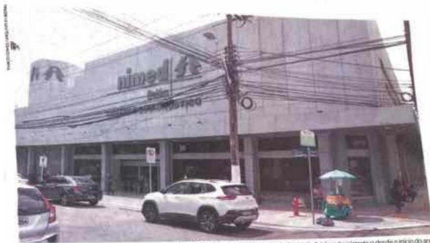
Diretoria da Unimed Belém está sob disputa judicial e administrativa desde o início do ano.