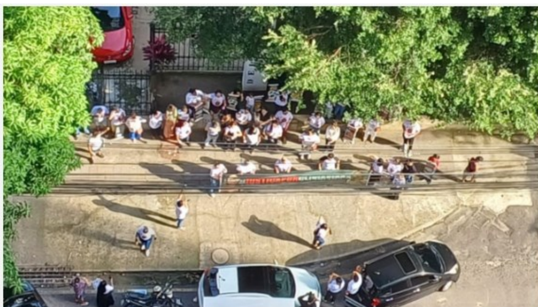
Manifestação ocorreu em frente ao prédio da Delegacia Geral da Polícia Civil, em Belém