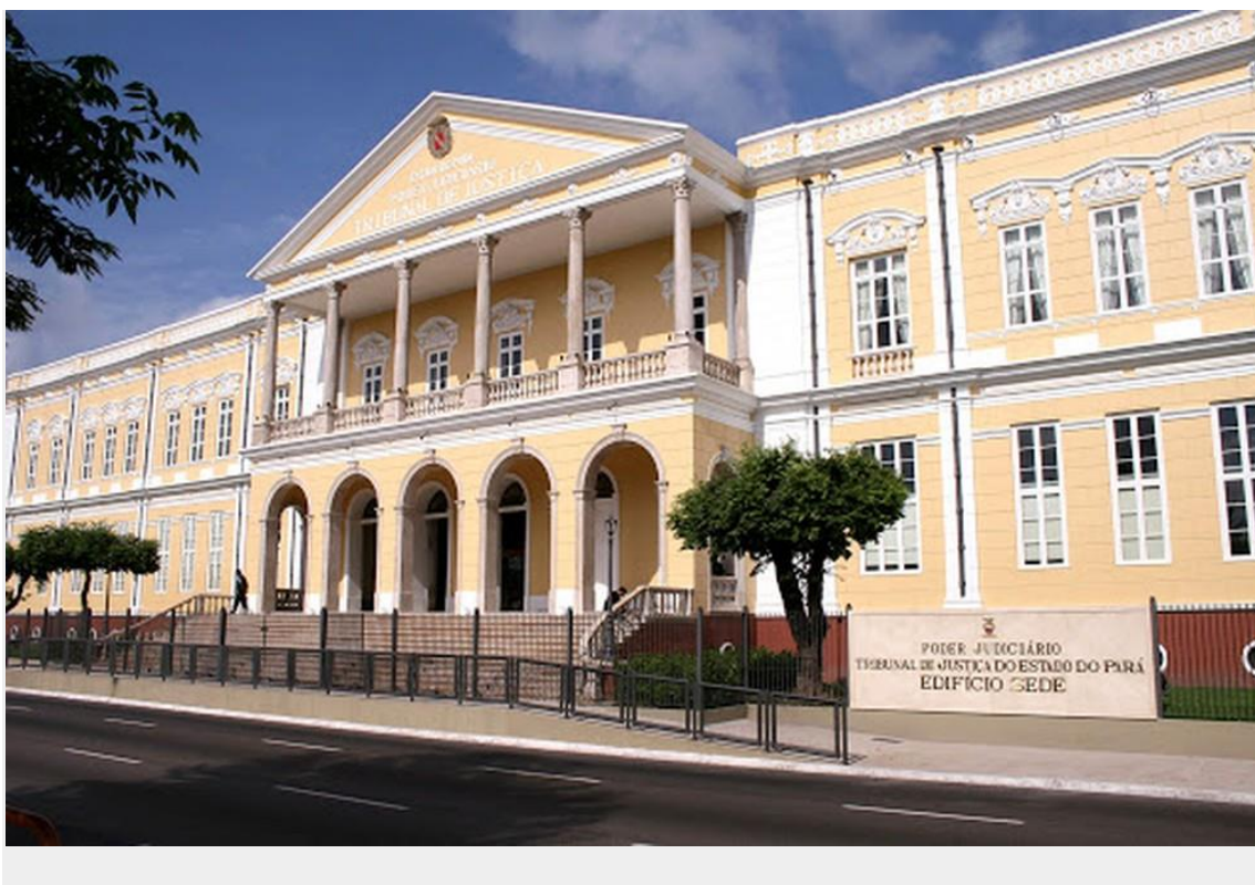
Tribunal de Justiça do Pará, em Belém