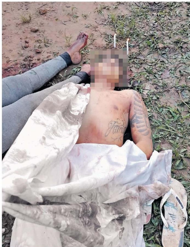
Um homem foi morto na cidade de Colares.

O denunciante ainda informou que o suspeito do crime tinha se evadido em direção a balsa que