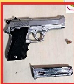
Um dos assaltantes foi preso após a tentativa de roubar e matar o policial em Vigia

Ao amanhecer, um motorista de outro carro acionou a Polícia Militar informando que foi obrigado, sob grave ameaça, levar um criminoso armado até o Terminal de Vigia, onde o bandido pegou um táxi e seguiu em