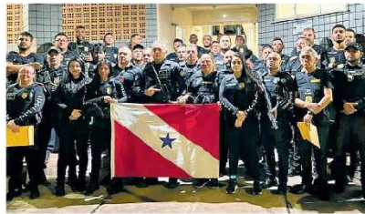
A operação mirou o combate ao crime em Santarém.

Desde as 6h desta sexta-feira (04), 46 policiais em onze viaturas e um suporte especializado saíram e realizaram o cumprimento de mandados para quinze pessoas com mandados de prisões preventivas e definitivas de Crimes Violentos