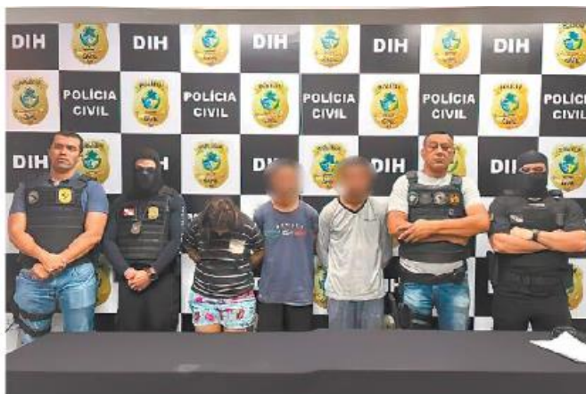
Crimes ocorreram no Pará, mas suspeitos tinham fugido para os Estados de Goiás e do Amazonas.