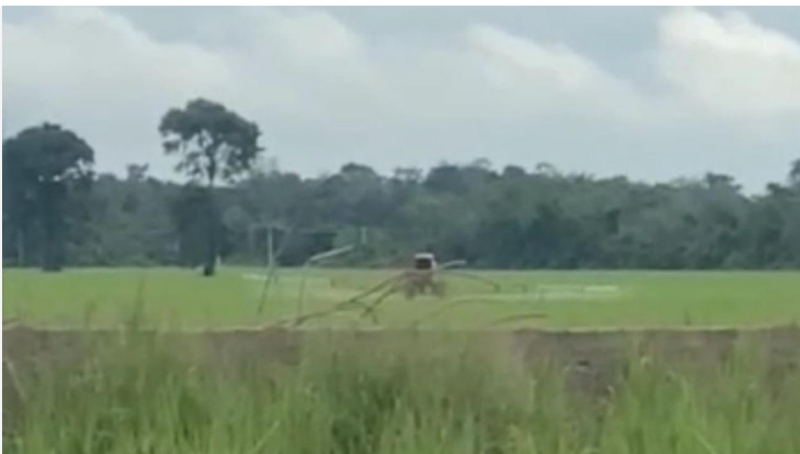
Uso de agrotóxico ocorre próximo à comunidade escolar, afirma o MPE