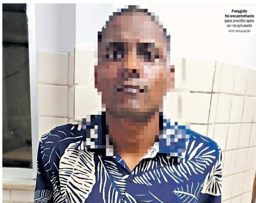
Foragido foi encaminhado para presídio após ser recapturado

O fujão foi apresentado na Delegacia de Polícia Civil do Centro de Castanhal e após ser ouvido pelo Delegado de plantão foi recambiado para o presídio para ficar no regime fechado até outra decisão do Poder Judiciário.