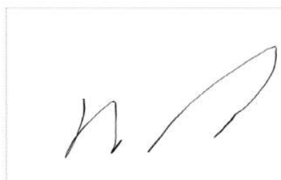
Assinatura de Alexandre de Almeida

Pontos de autenticação: Assinatura na tela IP: 179.214.126.52 / Geolocalização: -15.858779, -47.749284 Dispositivo: Mozilla/5.0 (Windows NT 10.0; Win64; x64; rv:108.0) Gecko/20100101 Firefox/108.0 Data e hora: 16 Dezembro 2022, 10:12:29 E-mail: brasilia@steno.com.br Telefone: + 5511987558739 Token: 1ff1d017-****-****-****-29d1bbafe0b9