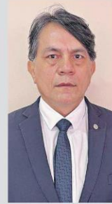
Estadual do Fórum Nacional Fundiário (TRT8/CNJ), no mesmo período.