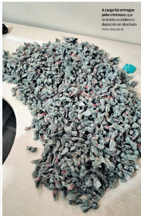
A carga foi entregue pelo criminoso, que se rendeu e colaborou depois de ser abordado