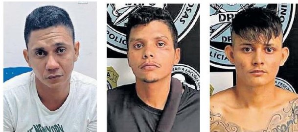
Além das prisões dos criminosos, policiais também apreenderam uma arma, drogas e outros objetos

to de homicídio pela 4ª Vara do Tribunal do Júri de Belém.