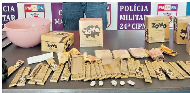
Oton Monteiro (à direita) possui passagens na polícia. PM apreendeu entorpecentes e R$ 3,3 mil

Após denúncia, policiais militares flagraram um homem com drogas e um mini laboratório em sua residência. Ele foi preso