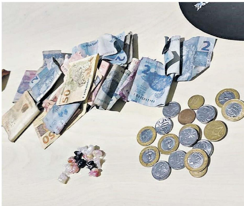
Mais de R$ 200 em notas pequenas também foram apreendidos pelos policiais militares na ação. A dupla foi apresentada na delegacia do município

Imediatamente depois do flagrante, a dupla foi apresentada na Delegacia de Polícia Civil do Centro de Castanhal, onde ficou de ser autuada pelos crimes de tráfico de drogas e associação para o tráfico de drogas.