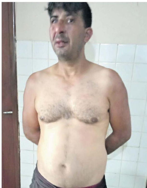
O acusado de agressão justificou o ato por, segundo ele, ter sido traído pela companheira.

Quando os militares abriram a porta, a mulher gritou: "Socorro! Ele quer me matar". Ela foi logo retirada do local enquanto o caminhoneiro era convidado a deixar o imóvel e se mostrava bastante agressivo e transformado.