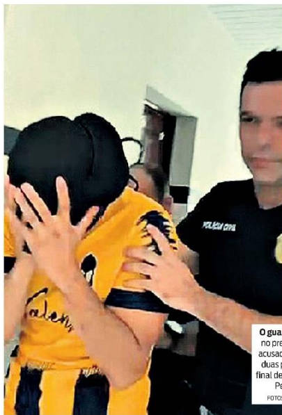
O guarda já está no presídio. Ele é acusado de matar duas pessoas no final de semana, na Pedreira.

Vítimas foram mortas durante uma discussão por causa do barulho de um aparelho de som no final de semana