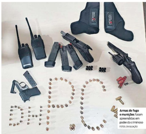
Armas de fogo e munições foram apreendidas em poder do criminoso

Em Santarém, oeste do Pará, José Gomes Filho foi detido por determinação do poder judiciário