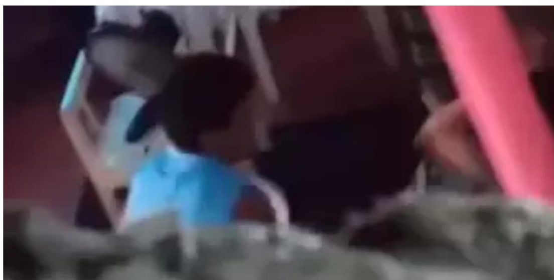
A idosa aparece sentada em uma rede. Logo em seguida, a filha surge e desfere um tapa no rosto da idosa.

Um vídeo que circula nas redes sociais mostra o momento em que uma idosa de 90 anos leva um tapa da própria filha , dentro da casa onde vive, no bairro do Distrito Industrial, em Ananindeua . O caso teria ocorrido na segunda-feira (5). Vizinhos teriam filmado a agressão, o que seria recorrente, segundo eles. A gravação foi divulgada pelo perfil Guerreiros do Pará, no Instagram.