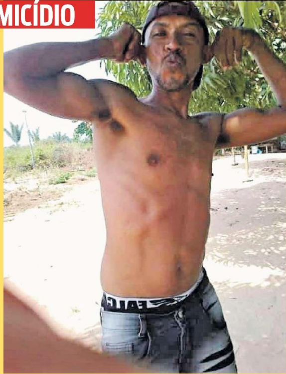
"Mãozinha" se desentendeu com um homem, com quem entrou em luta corporal e acabou assassinado

Policiais civis de Baião também se deslocaram à comunidade de Branquelândia para intimar testemunhas e investigar os motivos da discussão entre os dois, que terminou em morte.