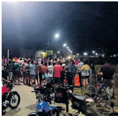
O assassino quase foi espancado por populares, mas conseguiu sair a salvo. Ele vai responder no Poder Judiciário Paraense por, no mínimo, três crimes

A equipe seguiu viagem até o local do crime, isolando a área e coletando imagens e relatos