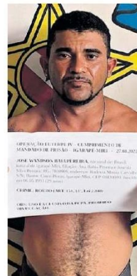
Quatro mandados foram cumpridos em Igarapé Miri, nordeste do Estado