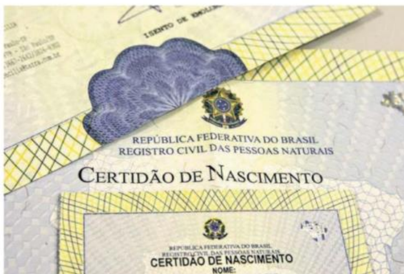
Houve aumento no registro de crianças com pai ausente no Estado em relação a 2021

Nos sete primeiros meses, em 2020, foram 61.053 nascimentos e 4.895 pais ausentes. Em 2019 foram registrados 72.062 nascimentos, sendo que 5.910 crianças não ganharam nome do pai. Já em 2018 foram 56.770 recém-nascidos registrados e 4.107 deles sem identificação paterna. Os números estão registrados no Portal da Transparência do Registro Civil, na página denominada Pais Ausentes, lançada em março, e que integra a plataforma nacional, administrada pela Associação Nacional dos Re-