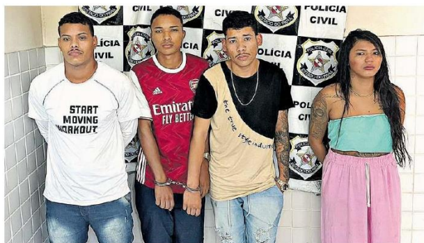
Os quatro foram presos em flagrante por crime de roubo qualificado.