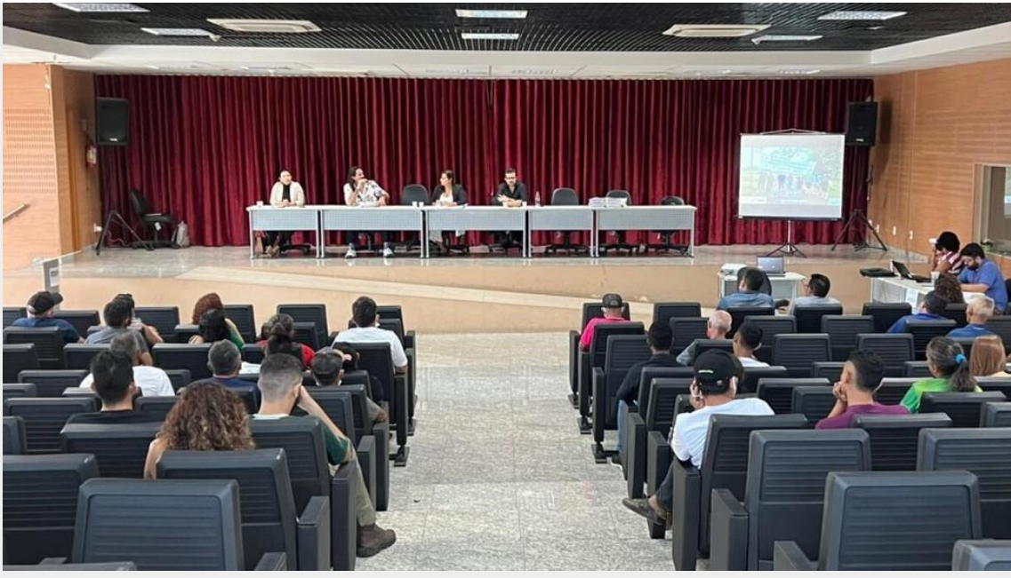
Fórum Permanente do MPPA promove reunião extraordinária em Santarém

O Fórum Permanente do Ministério Público do Estado do Pará com a sociedade civil para questões agrárias e fundiárias, realizou um encontro no último dia 4 de agosto, no auditório da Promotoria de Justiça de Santarém , região oeste, para discutir medidas que visam solucionar conflitos na região.