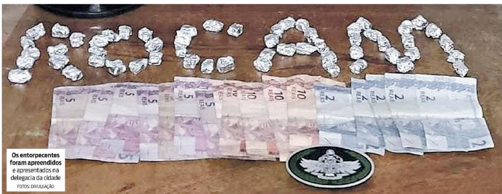
Os entorpecentes foram apreendidos e apresentados na delegacia da cidade