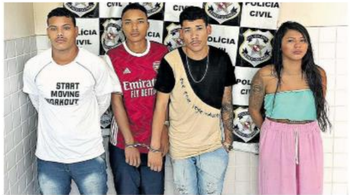
Os quatro foram presos em flagrante por crime de roubo qualificado.