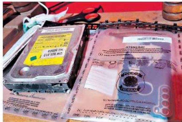
PF cumpriu mandados contra investigados por guardar fotos e vídeos com cenas de abuso e exploração sexual infantil.

Mandados de busca e apreensão foram cumpridos em casas de suspeitos em guardar material pornográfico infantil