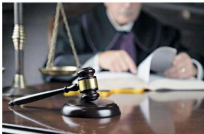
A sentença condenatória manteve as prisões preventivas e negou aos sentenciados o direito de recorrer em liberdade

De acordo com a sentença, "Conclui-se, portanto, que restou plena e solidamente configurado o delito de organização criminosa, tendo sido devidamente demonstradas, conforme já dito, a autoria e a materialidade deliti-