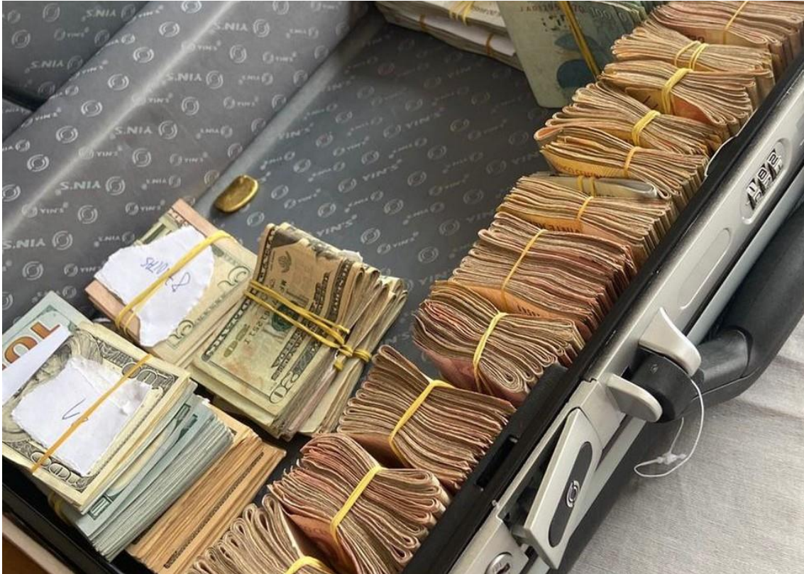
Operação mira sócios de empresas ligadas a apostas esportivas no Pará.