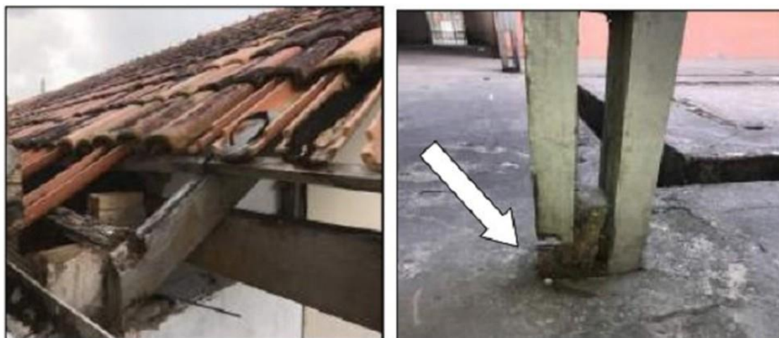
Inspeção em escola pública de Anajás constata irregularidades na infraestrutura

ocorrida em abril deste ano. Com o avanço da apuração dos fatos, os autos foram convertidos em procedimento administrativo.