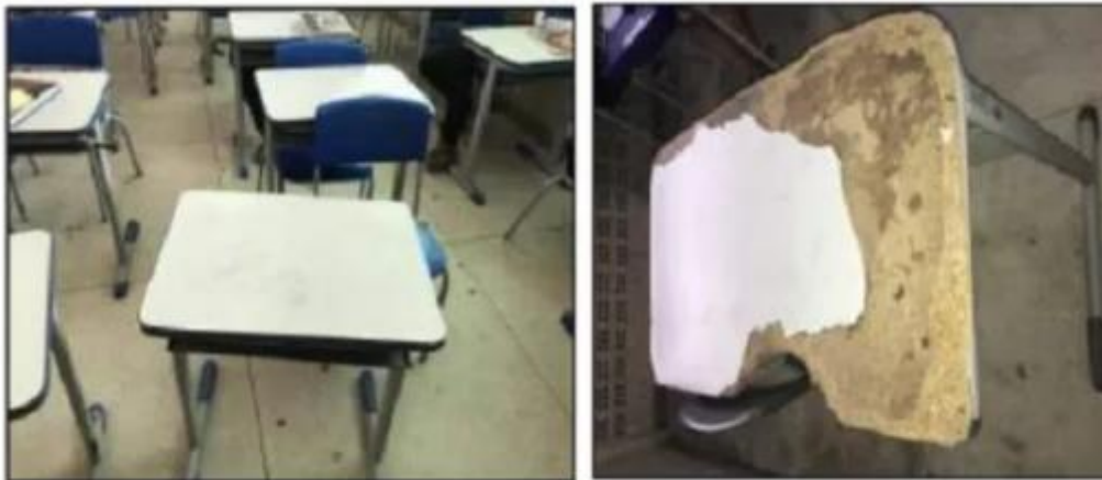
Inspecção em escola pública de Anajás constata irregularidades na infraestrutura — Foto: MPPA.

A Justiça do Estado determinou que o Estado do Pará, no prazo de trinta dias, apresente um cronograma e inicie uma série de adaptações em relação ao prédio da E.E.E.M. Rui Barbosa, no município de Anajás. As informações são desta terça-feira (19). O g1 entrou em contato com a Secretaria de Educação do Estado e aguarda posicionamento.