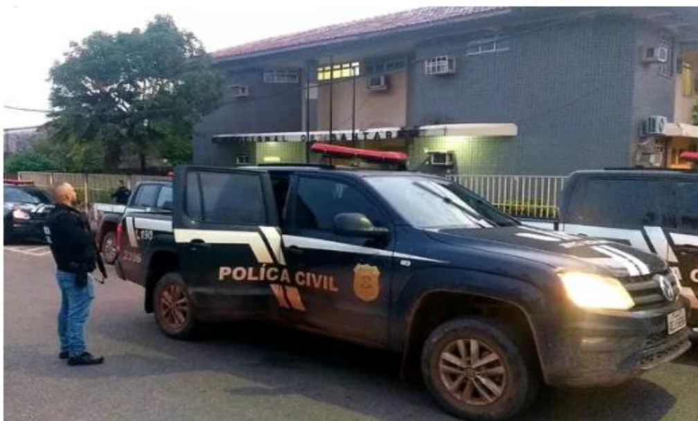
Seccional Urbana de Polícia Civil de Santarém