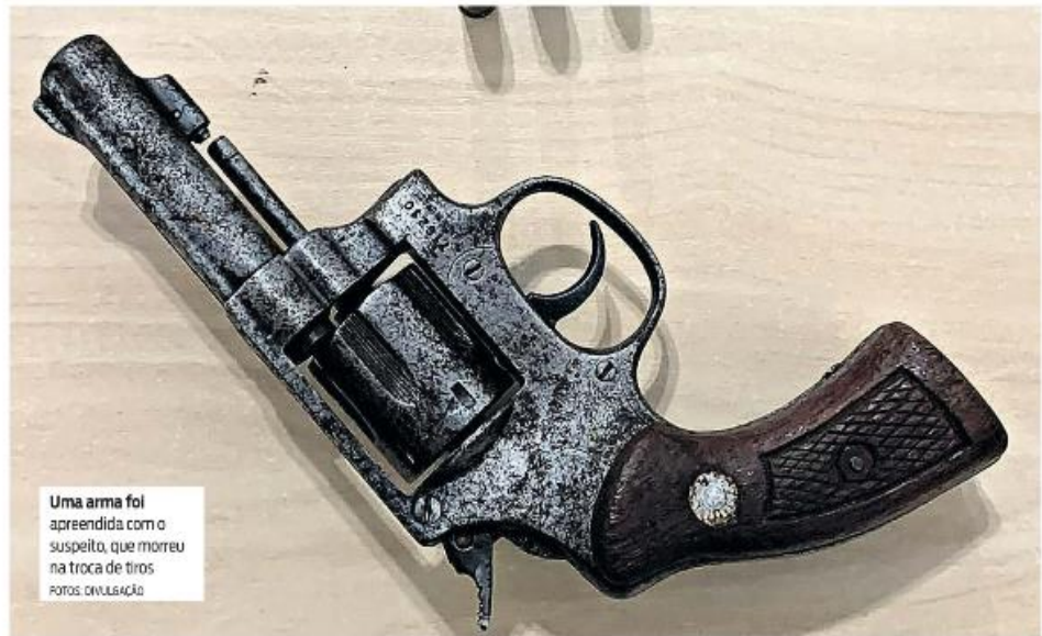
Uma arma foi apreendida com o suspeito, que morreu na troca de tiros

Segundo o registro da ocorrência, ele, ao avistar os po-