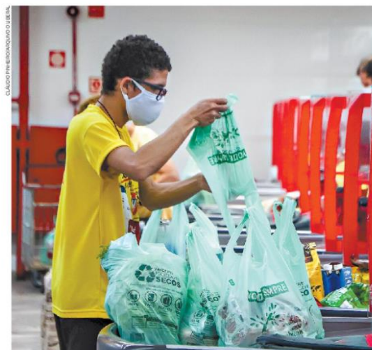
Supermercados passaram a oferecer sacolas feitas com 51% dos materiais biodegradáveis