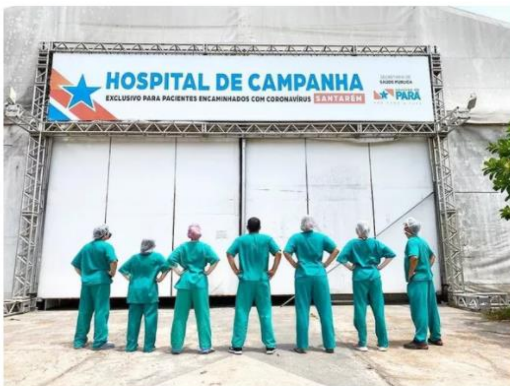
Médicos que atuaram no Hospital de Campanha de Santarém devem receber pagamentos que ficaram pendentes

O juiz titular da 6ª Vara Cível e Empresarial de Santarém , no oeste do Pará, Claytoney Passos, decidiu após audiência de conciliação realizada nesta quarta-feira (29) pela liberação de parte dos recursos bloqueados do Instituto Panamericano de Gestão (IPG) para pagamento de plantões de médicos contratados pela OS no município para atuação no Hospital de Campanha.