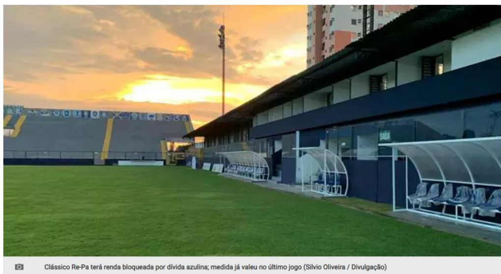
Clássico Re-Pa terá renda bloqueada por dívida azulina; medida já valeu no último jogo

O Remo terá 10% da renda do Re-Pa bloqueada. A medida vem por meio de uma decisão judicial da 13ª Vara Cível e Empresarial, que determinou a confiscação de parte da renda do clássico, que ocorre no próximo domingo (3), às 17h, no Estádio do Baenão. O jogo é válido pela 13ª rodada da Série C do Campeonato Brasileiro.