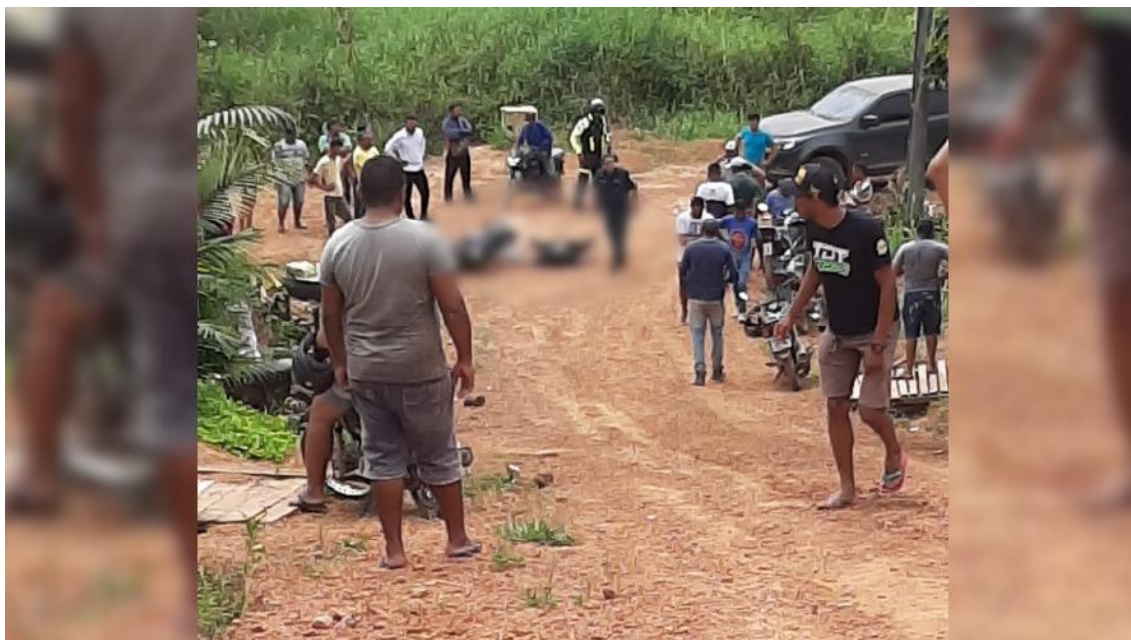
Vítima não teve chance de defesa e morreu na hora

teriam anunciado um assalto. A vítima teria reagido e acabou morta a tiros de arma de fogo.