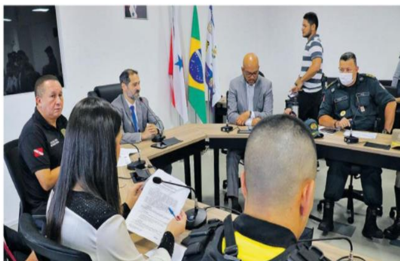
A reunião realizada na manhã de ontem, na sede da Segup, definiu todos os detalhes para a apresentação do plano de ações do Estado

As atividades e estratégias de policiamento integrado coordenadas pela Segup vão ocorrer ao longo dos cinco finais de semana do mês de julho, com 260 viaturas, entre veículos de quatro rodas e motocicletas, três aeronaves e três embarcações, que serão utilizadas pelas equipes para dar maior efetividade nas ações em áreas de praias e balneários, localizados nos distritos de Outeiro e Mosqueiro, e nos municípios de Vigia, Colares, Curuçá, Marapanim, Marudá, Salinópolis, entre outros.