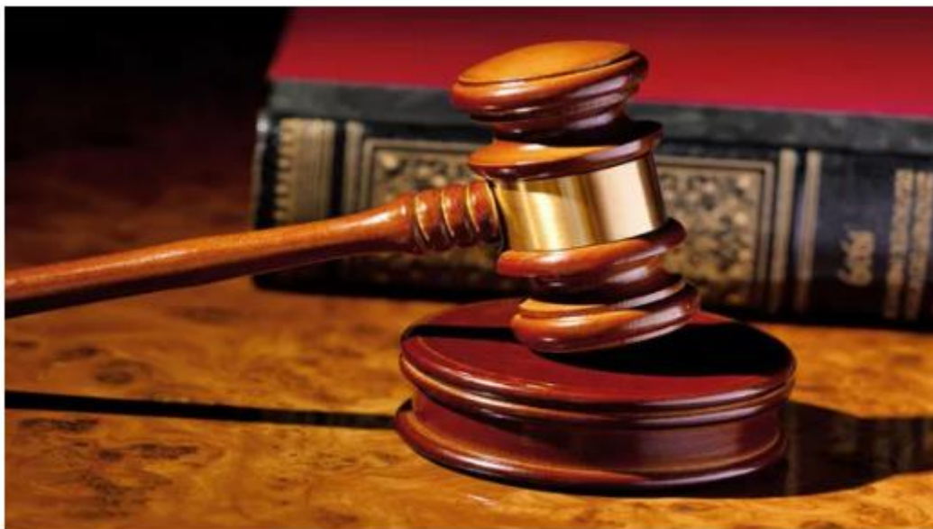
Martelo da Justiça (imagem meramente ilustrativa)