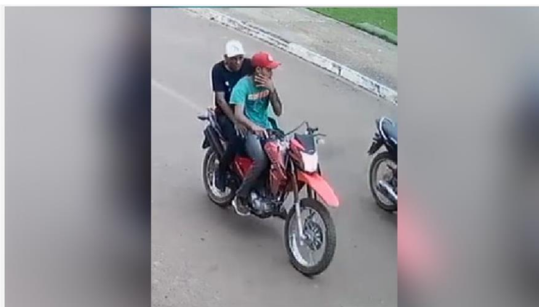
Câmara flagra o momento em que os dois suspeitos passam na moto