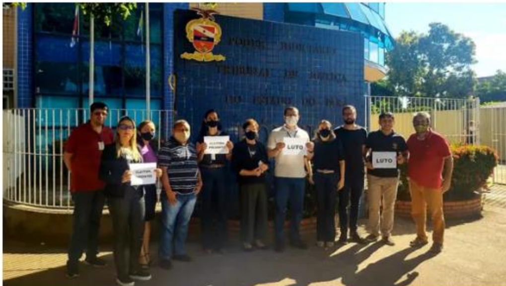
Servidores do Judiciário fazem protesto em frente ao Fórum de Justiça em Santarém