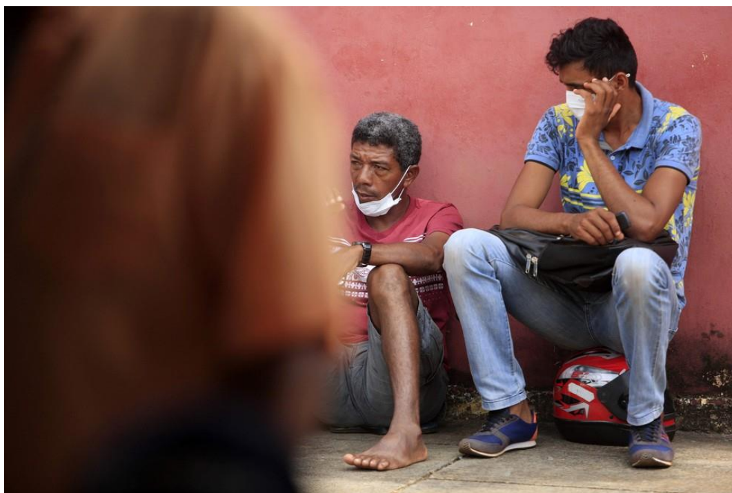
Familiares aguardam liberação de corpos de mortos no 'Massacre em Altamira', no Pará

A unidade penitenciária foi desativada, após o episódio. Os detentos que estavam custodiados foram transferidos para o Complexo Penitenciário de Vitória do Xingu há 1 ano e 8 meses. A estrutura do antigo presídio está passando por reforma.