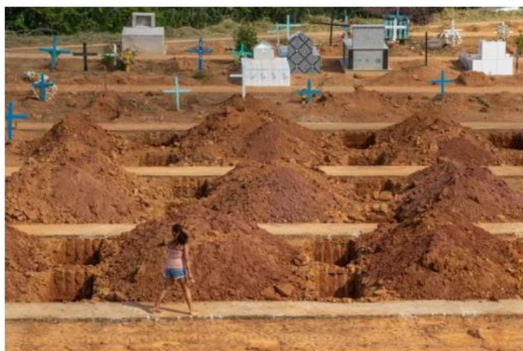
Escavadeira de covas no cemitério São Sebastião em Altamira, destinado às vítimas do massacre do Centro de Recuperação Regional de Altamira.

Sobreviventes e parentes dos detentos mortos no massacre do presídio de Altamira , no sudoeste do Pará, ocorrido em 2019, vão receber indenizações do estado. Foram 62 mortos. O caso é maior tragédia carcerária do Brasil depois de Carandiru, no rio de Janeiro.