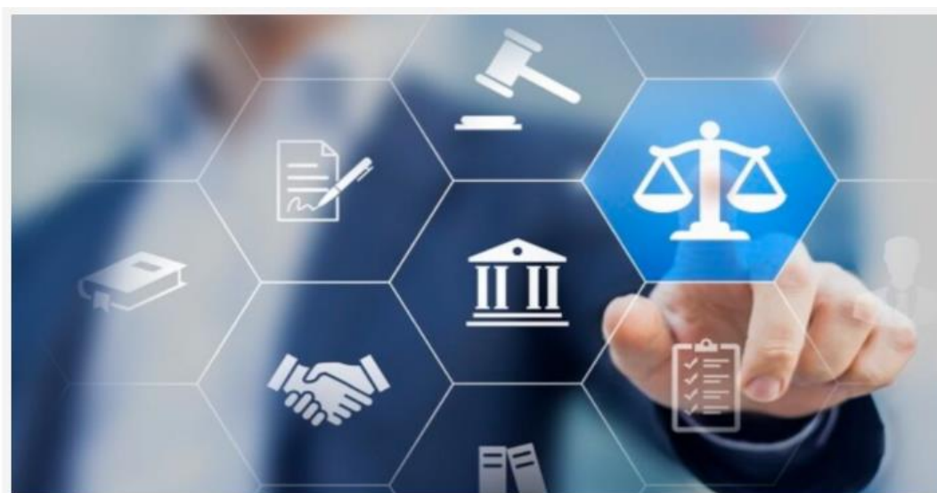
nova versão do sistema do Processo Judicial Eletrônico (PJe)

Desenvolvido pelo CNJ (Conselho Nacional de Justiça) em conjunto com a Ordem dos Advogados do Brasil (OAB) e tribunais, o sistema de Processo Judicial eletrônico é uma ferramenta que busca facilitar a consulta e acompanhamento dos processos judiciais em suas diversas frentes: Justiça Federal, Justiça dos Estados, Justiça Militar dos Estados e Justiça do Trabalho.