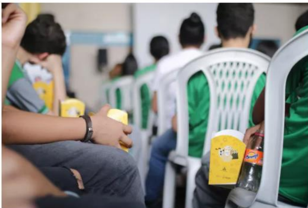
Alunos aparecem sentados em cadeiras de plástico em uma sala de aula.

O Ministério Público do Estado do Pará (MPPA) ajuizou duas Ações Civis Públicas contra o Estado pedindo que o direito à educação seja cumprido por meio da contratação de profissionais para realizarem o Atendimento Educacional Especializado (AEE) nas escolas estaduais dos municípios de Paragominas e Ipixuna do Pará , sudeste do Pará.