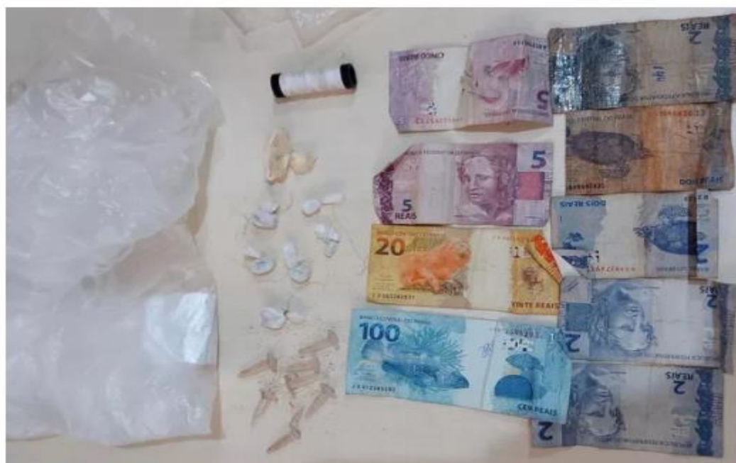
Drogas, dinheiro e material para embalar entorpecente foram apreendidos em uma residência no bairro Amparo

Dois homens foram presos em flagrante por tráfico de drogas nesta sexta-feira (24), durante a “Operação palestina” que foi desencadeada na grande área do Santarenzinho, em Santarém , oeste do Pará, pelas equipes da UIP do