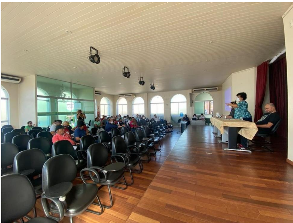
Reunião no Teatro Vitória sobre os cursos do Pronera

24/06/2022 11h27 Atualizado há 32 minutos