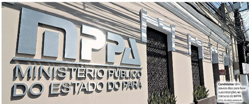
Candidatos têm poucos dias para fazer suas inscrições ao concurso do MPPA