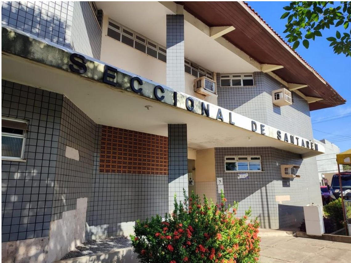
Caso foi registrado na 16ª Seccional Urbana de Polícia Civil

Um homem foi preso por tentativa de furto em menos de 48h depois de sair da penitenciária de Santarém , no oeste do Pará. O caso foi um dos 7 registrados no plantão policial da noite de quinta (16) e madrugada de sexta (17).