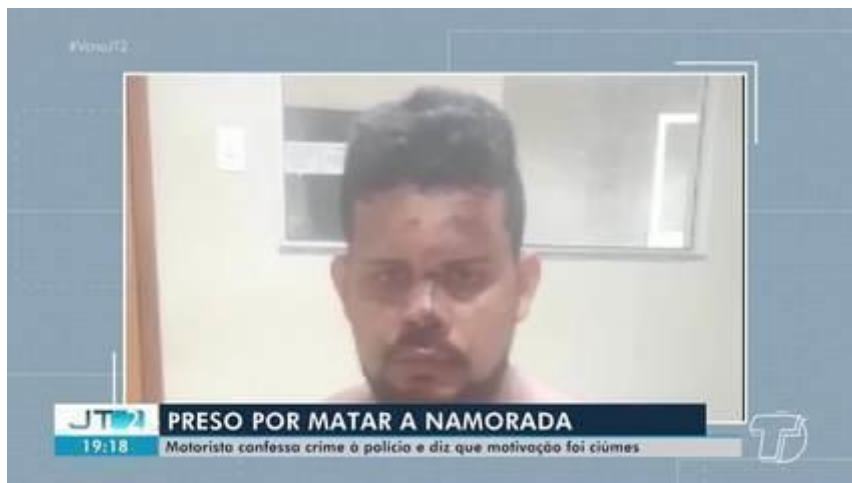
Homem confessa que matou a namorada por ciúmes em Belterra

Na mesma decisão que definiu a data de julgamento de Makaivo, o juiz Gabriel Veloso ainda manteve a prisão cautelar do acusado e decidiu sobre as provas a serem produzidas em plenário.