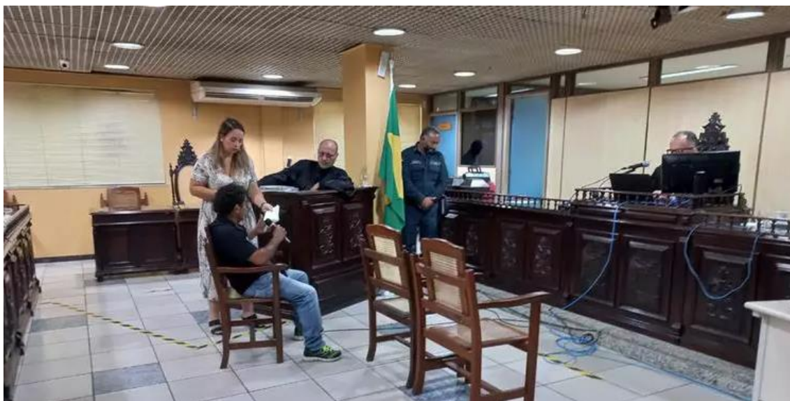
Condenados foram julgados pela 4ª Vara do Tribunal do Júri de Belém. ()