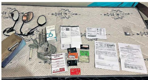
Documentos e objetos apreendidos durante a operação. Bando "legalizava" veículos furtados e os revendia

Policiais civis cumpriram mandados no município e também em Bragança. Suspeitos teriam participação em diversos crimes envolvendo revenda de veículos