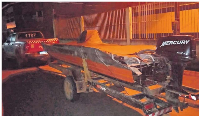
A carretinha foi furtada em Pau D'Arco. Abaixo, os tablettes de maconha. Policiais desconfiaram do nervosismo do homem e logo acharam a droga

O homem se mostrou nervoso, o que levou a guarnição, com sua autorização, a uma revista, sen-