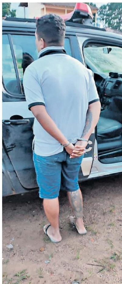
Um dos suspeitos presos durante a operação da Polícia Civil

O delegado Luiz Guilherme, responsável pela operação, informou que as investigações policiais apontaram que o grupo criminoso já atuava há alguns anos naquela cidade, operando de forma integrada com outros membros do bando.