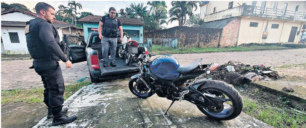
Motos apreendidas durante a ação. Um total de 31 policiais civis participaram da operação nos dois municípios. Justiça deferiu os pedidos de mandados de prisão, de buscas e de apreensões