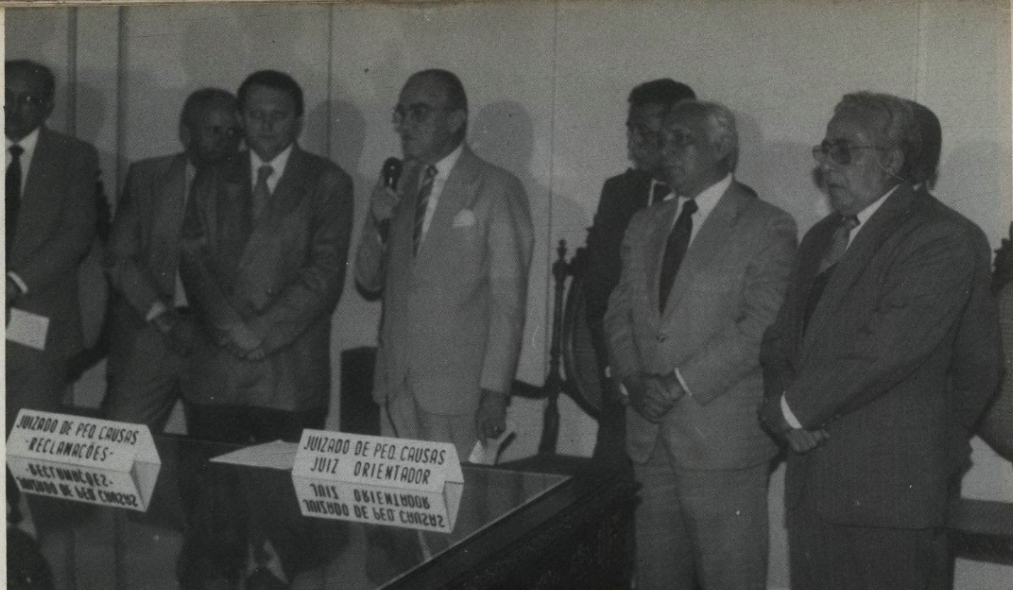
Instalação do Juizado de Pequenas Causas