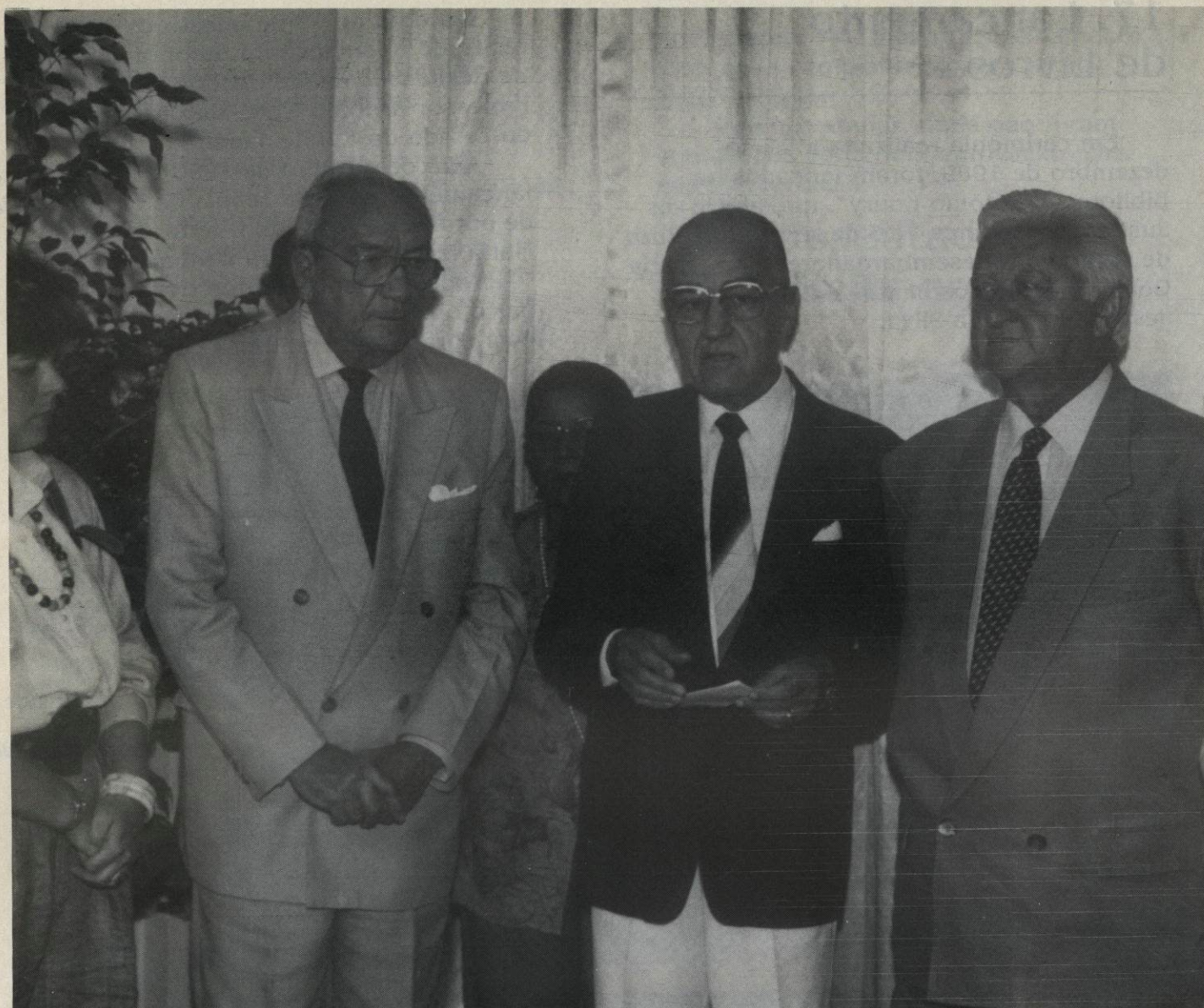
Ato de instalação dos sistemas SOF, SRH e Mala Direta