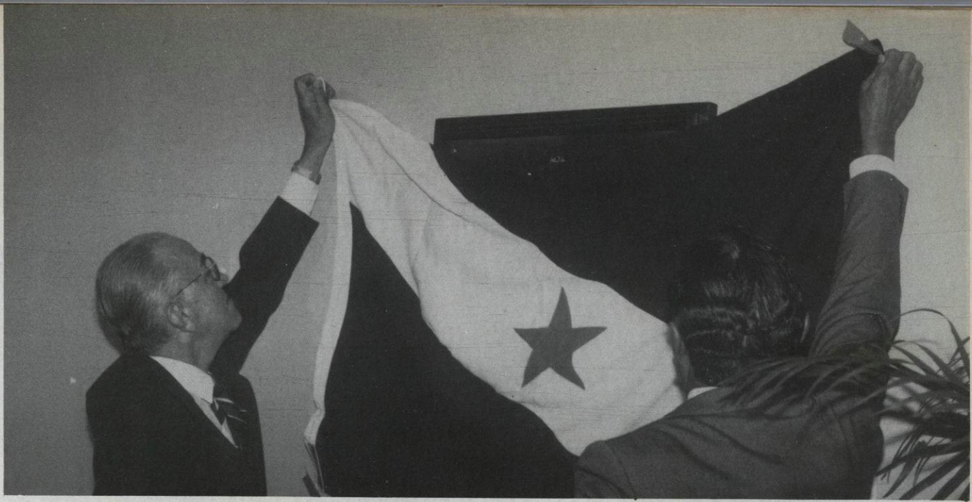
Reinauguração do Salão do Tribunal do Júri