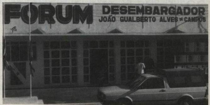
Fórum da Comarca de Tucumã