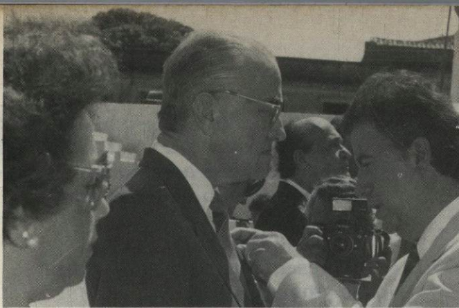
Solenidade de outorga da Comenda Francisco Caldeira Castelo Branco, da Prefeitura Municipal de Belém