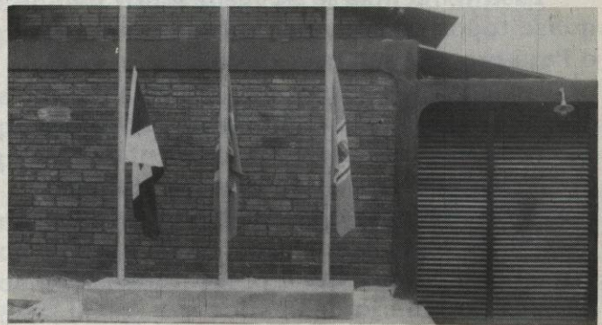
Fórum da Comarca de Curionópolis