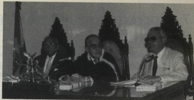
Sessão Solene da Instituição dos Cursos Jurídicos no Brasil

As Câmaras Cíveis Reunidas realizaram, durante o ano de 1990, 36 Sessões Ordinárias e três Sessões Extraordinárias e nelas foram proferidas 1.690 votos.