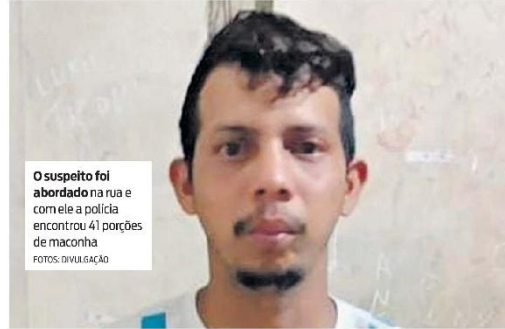
O suspeito foi abordado na rua e cometeu a polícia encontrou 41 porções de maconha