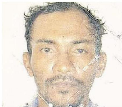
A vítima morreu sem chance de defesa e o acusado foi preso em seguida em flagrante.

Acusado foi preso logo após o crime em São Miguel do Guamá e já tinha passagens pela polícia anos atrás