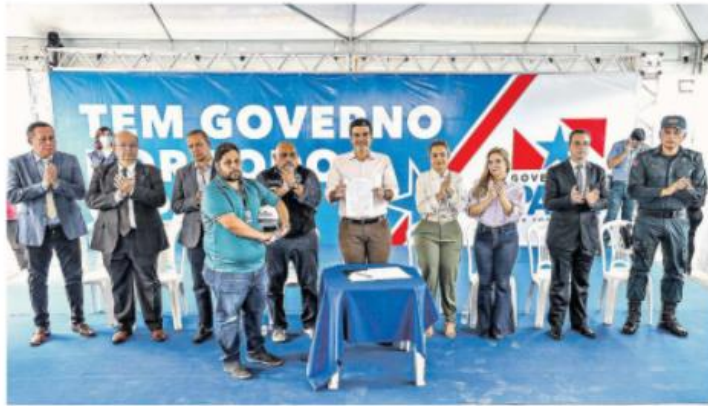
O governador Helder Barbalho assinou ontem as ordens de serviço. Helder também verificou as unidades que serão readequadas.

Segundo o defensor público, a luta para acabar com esse modelo é antiga, mas só agora veio a solução definitiva. "Todo avanço dentro do sistema prisional traz resultados positivos para o Estado como um todo, porque o controle dos estabelecimentos prisionais faz com que a criminalidade fora também diminua, e isso é visível nos índices de criminalidade que nós temos hoje no Pará", ressaltou Caio Favero.