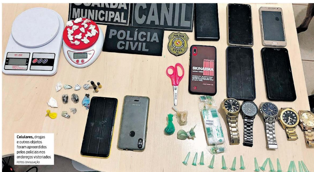
Celulares, drogas e outros objetos foram apreendidos pelos policiais nos endereços visitados

ram encontrados 19 pequenos embrulhos com cocaína, sete pequenas trouxas de maconha e ainda duas munições para arma de fogo, uma cápsula deflagrada de calibre 32, além de materiais para embalar droga e balanças de precisão.