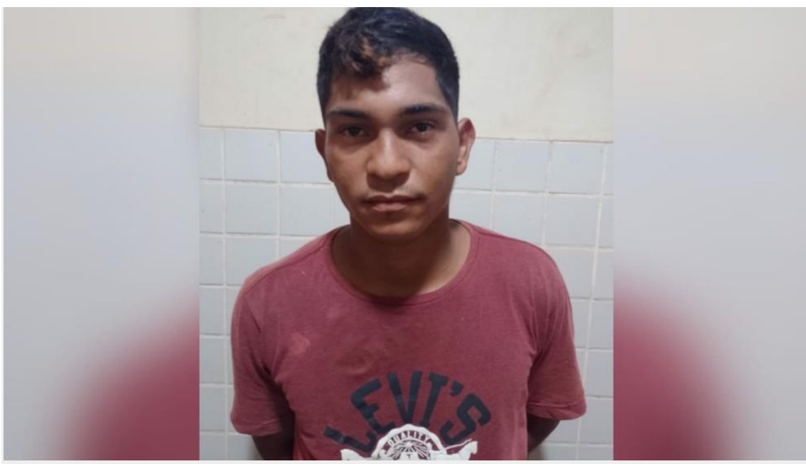
Jovem foi preso no sábado (26) em Rurópolis

Um jovem de 21 anos foi preso por tentar estuprar uma idosa de 75 anos em Rurópolis no oeste do Pará. A Operação Camafeu foi deflagrada pela Polícia Civil no sábado (26) para dar cumprimento ao mandado de prisão preventiva do suspeito.