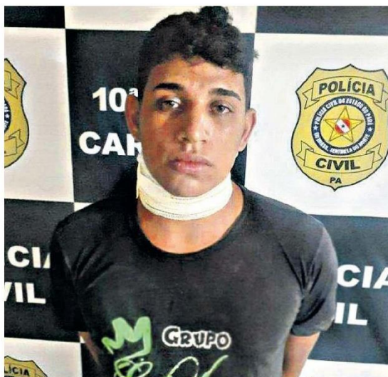
O acusado não se conformou com a separação e decidiu matar a ex-mulher

A Polícia Militar foi acionada e prendeu em flagrante o autor do feminicídio que tinha um pequeno ferimento no pescoço sendo medicado, autuado em flagrante delito e encaminhado ao complexo penitenciário de Marabá ficando a disposição da justiça.