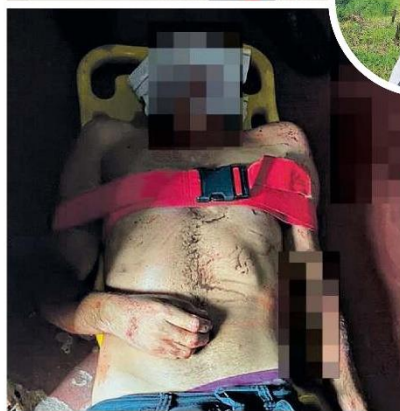
Um dos suspeitos morreu no confronto com a polícia. Ele estava em prisão domiciliar e andava com uma pistola.

Cessada a situação, os policiais acionaram uma equipe de resgate do Corpo de Bombeiros que de imediato compareceu no local e encaminhou o suspeito até a Unidade de Pronto Atendimento de Vila dos Cabanos onde morreu.