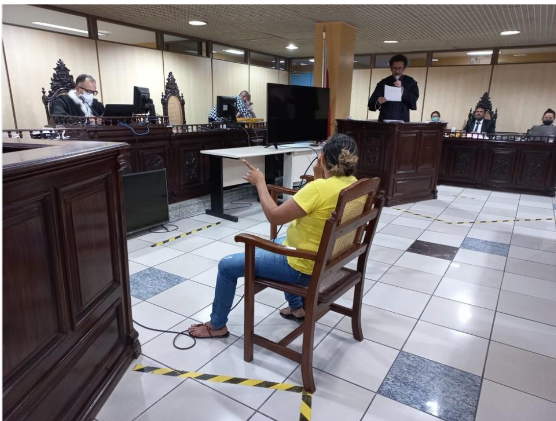
Crime ocorreu em 2003 em Icoaraci

Em julgamento nesta terça-feira (12), em Belém , mulher acusada de matar o marido com uma garrafa de cerveja na cabeça foi absolvida. Crime ocorreu em 11 de julho de 2003, na pousada dos Beija Flores, no distrito de Outeiro.