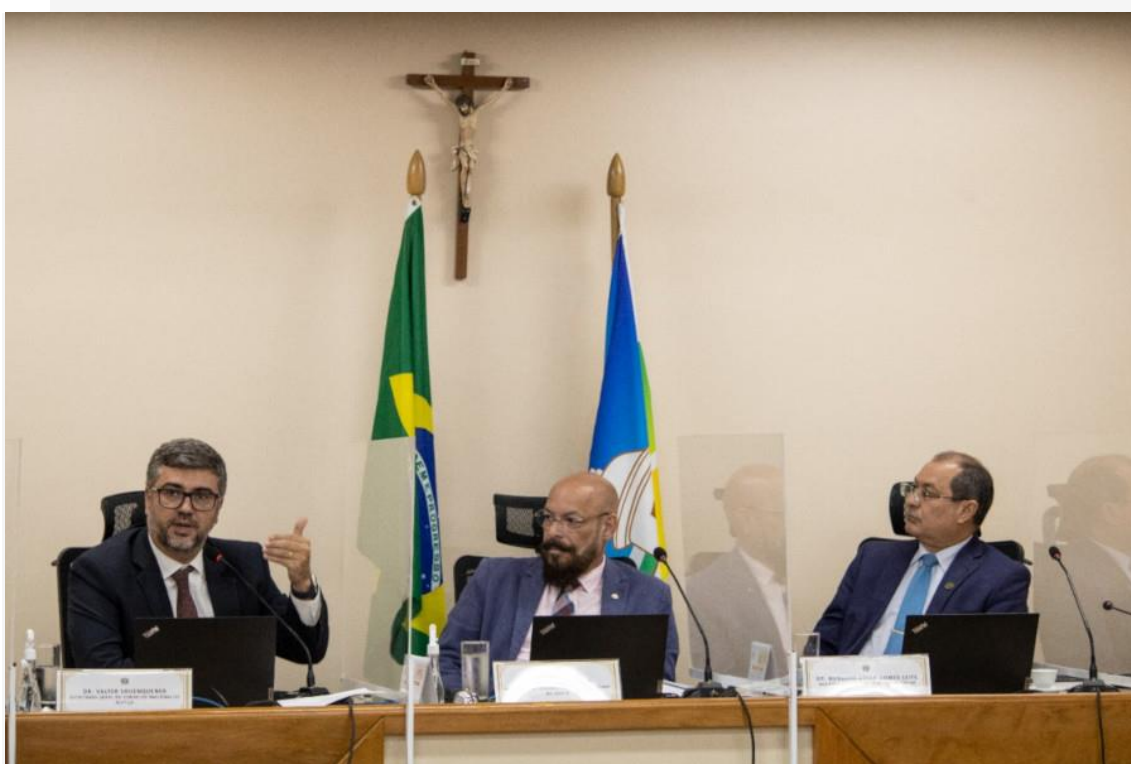
Administração do TJAP apresentou as principais realizações do Justiça 4.0 no estado.

O Tribunal de Justiça do Amapá (TJAP) avança na atualização do Processo Judicial Eletrônico (PJe) e na migração do sistema Tucujuris para o PJe nas unidades judiciárias, visando à integração à Plataforma Digital do Poder Judiciário . A evolução foi apresentada na última quarta-feira (6/4), em reunião de representantes do Conselho Nacional de Justiça (CNJ), do TJAP e do Tribunal