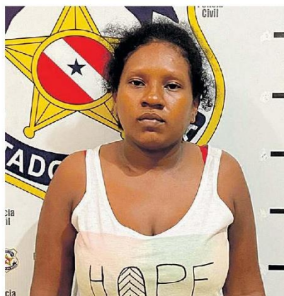
Os pais da criança foram presos e a necropsia aponta possível estupro cometido contra a vítima.

O casal foi encaminhado à delegacia de Novo Repartimento para prestarem depoimento enquanto o cadáver da bebê era submetido a