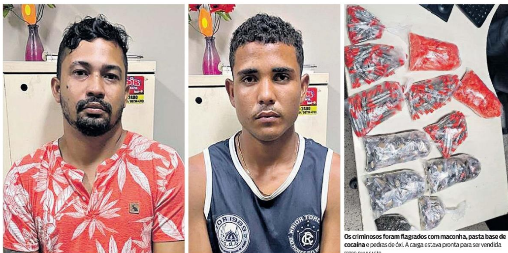
Os criminosos foram flagrados com maconha, pasta base de cocaína e pedras de óxi. A carga estava pronta para ser vendida