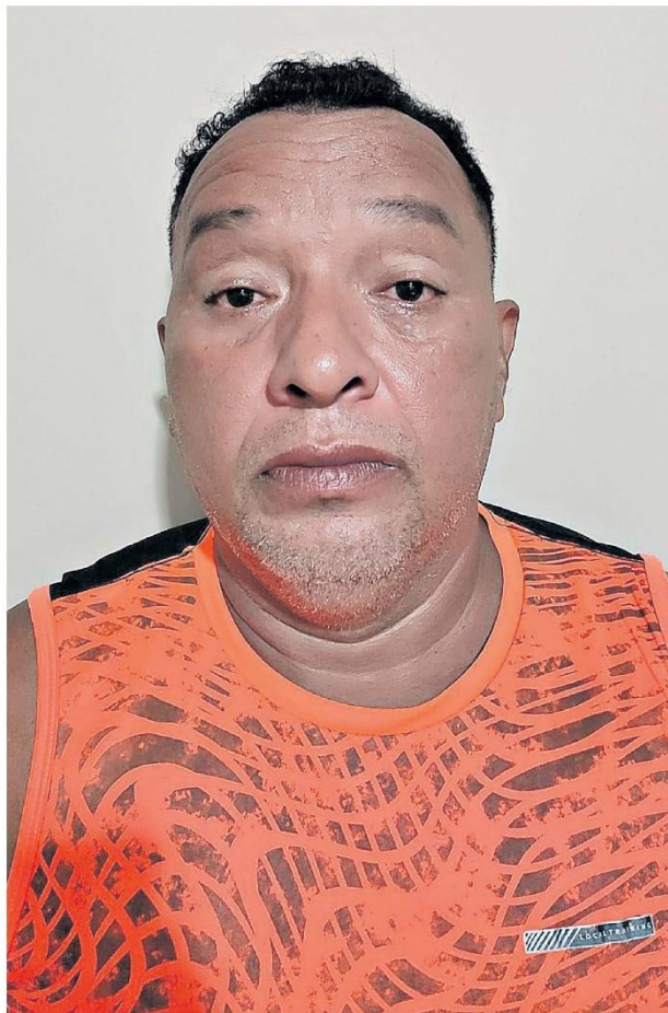
O criminoso conseguiu escapar das autoridades por 16 anos, mas ele foi encontrado no bairro do Tapanã, em Belém

O homicida foi encontrado na rua Cabanos, no bairro do Tapanã, e não resistiu à prisão. Ele foi levado para exames de corpo de delito e posteriormente encaminhado à Secretaria de Administração Penitenciária, onde ficará à disposição do Poder Judiciário de Marabá.