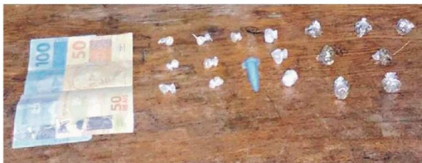
Além dos entorpecentes, os criminosos também foram flagrados com cédulas de dinheiro, que foram apreendidas

Hélio Pereira foi autuado em flagrante delicto pelo crime de tráfico de drogas e já se encontra à disposição do Poder Judiciário.