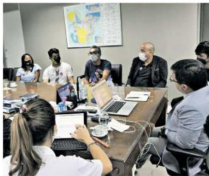
Durante o Fórum Permanente, a pauta foi amplamente debatida

Um Grupo de Trabalho, coordenado pela Semas, reúne integrantes das prefeituras de Belém e Ananindeua para discutir a destinação correta de resíduos de forma perma-