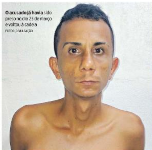
O acusado já havia sido preso no dia 23 de março e voltou à cadeia