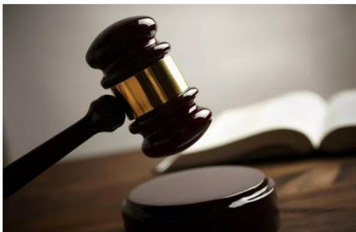
Martelo justiça (imagem ilustrativa)