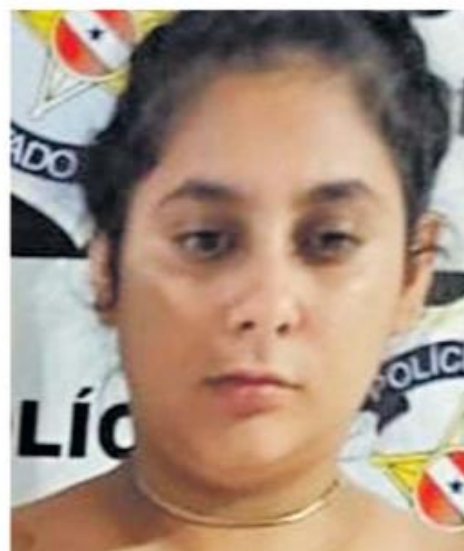
Os dois foram presos em flagrante com drogas. O homem tinha mandado de recaptura expedido pela Justiça.