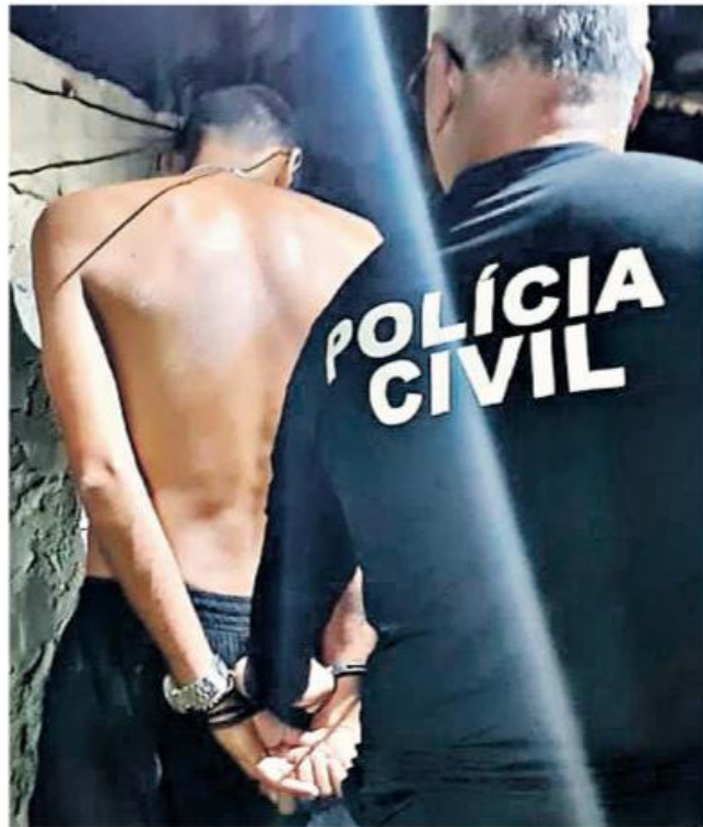
O suspeito foi preso durante a operação em Marabá nesta quinta-feira (7)

A investigação também identificou que os integrantes da orga-