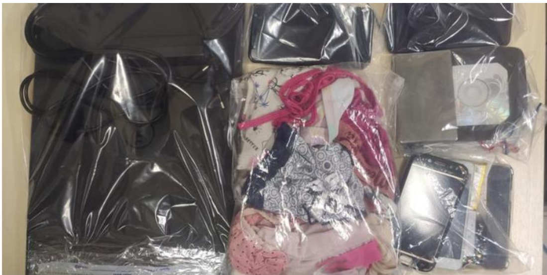
Material apreendido durante operação de combate à pedofilia em Castanhal. Um oficial da PM foi preso

Duas pessoas, entre as quais um oficial da Polícia Militar, foram presas, em Castanhal, durante operação para combater pedofilia naquele município no nordeste paraense. O Ministério Público do Estado, por meio da Promotoria de Justiça de Castanhal, participou, na terça-feira (15), dessa ação integrada com a Polícia Civil e Corregedoria da Polícia Militar. Um dos presos, detido em sua residência nas primeiras horas do dia, é oficial da Polícia Militar.