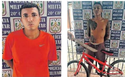
Os criminosos foram parar atrás das grades, depois da atuação da Polícia Militar. Um deles roubou uma bicicleta e agrediu um menino de nove anos de idade

Segundo as informações apuradas, a guarnição de serviço recebeu uma denúncia, através do telefone interativo, de que estavam comercializando entorpecentes na passagem do Corro, periferia de Muaná, tendo suspeito um homem cuja característica foi repassada à guarnição.