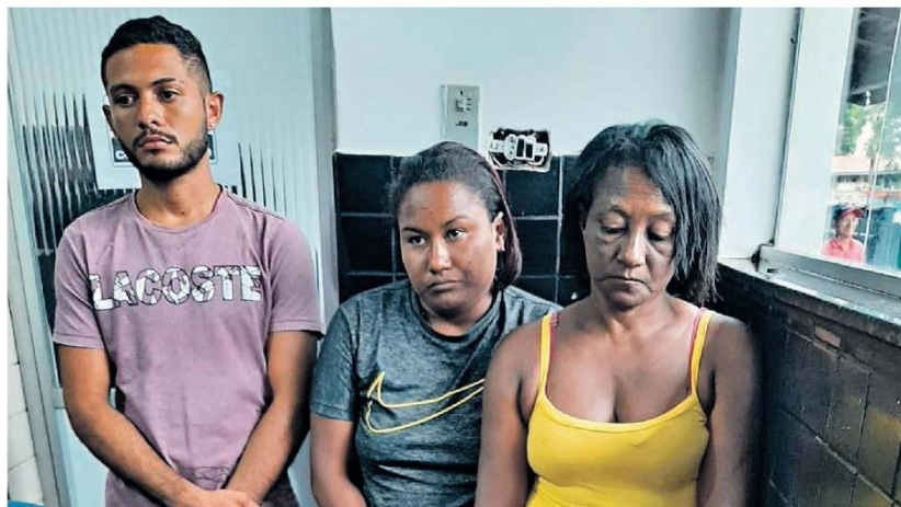
O trio foi detido e com eles apreendidas algumas porções de entorpecentes

A barca do Grupamento Tático Operacional esperou o melhor momento para abordar o trio, que transportava uma sacola com 16 porções de drogas, uma porção maior e um livro caixa contendo a contabilidade de um produto identificado como "massa".