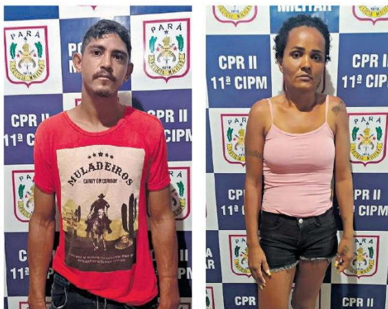
Os acusados foram levados para a cadeia, onde já estão à disposição da Justiça. A carga acabou apreendida

Diante dos fatos, os acusados, juntamente com todo o material apreendido, foram conduzidos algemados, para sua própria segurança e para segurança dos componentes da guarnição, e apresentados, sem lesões corporais, na delegacia de Polícia Civil de Bom Jesus do Tocantins, onde se encontram custodiados à disposição da polícia judiciária.