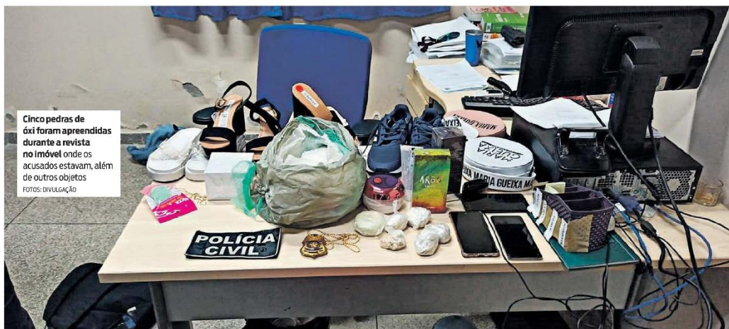
Cinco pedras de óxi foram apreendidas durante a revista no imóvel onde os acusados estavam, além de outros objetos