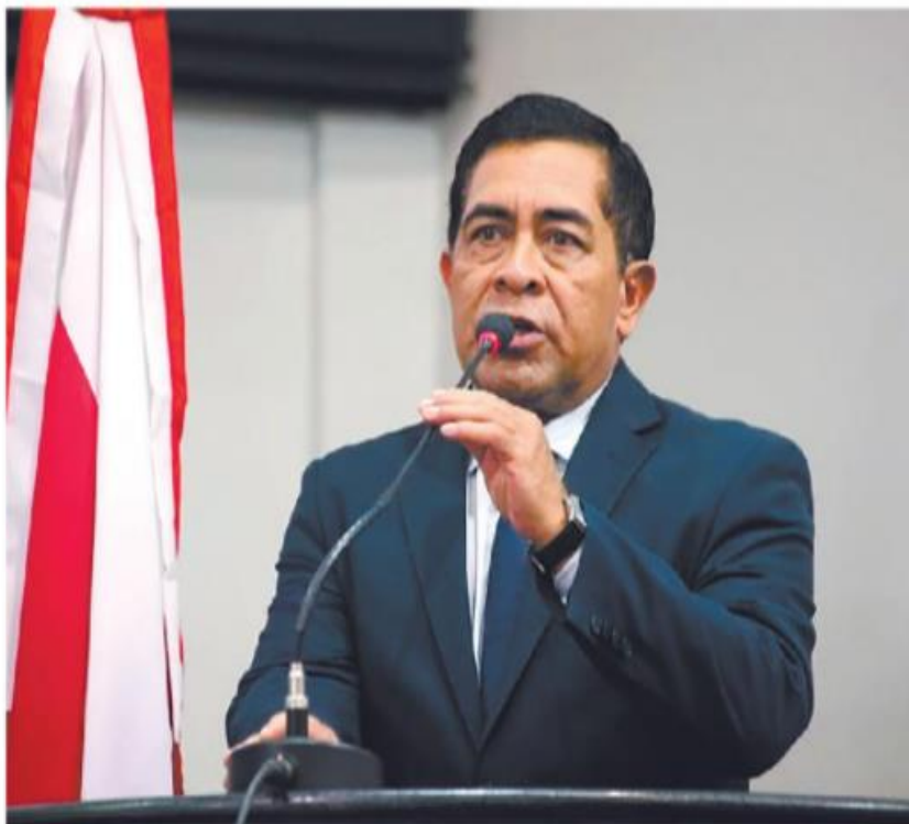
Bordalo quer apuração sobre violações dos direitos dos quilombolas na região de Acará

M ais um parlamentar paraense reagiu contra as ações da empresa Agropalma, que vem sendo acusada de danos ao meio ambiente, grilagem de terra e desrespeito aos direitos humanos contra populações tradicionais. Na edição do último domingo (13), o jornal O Liberal mostrou o sofrimento da comunidade quilombola Nossa Senhora da Batalha, no limite entre os municípios do Acará e Tailândia, no nordeste do Pará, que foram surpreendidos com grandes contêineres posicionados na área pela empresa para impedir que os quilombolas saiam e entrem no ter-