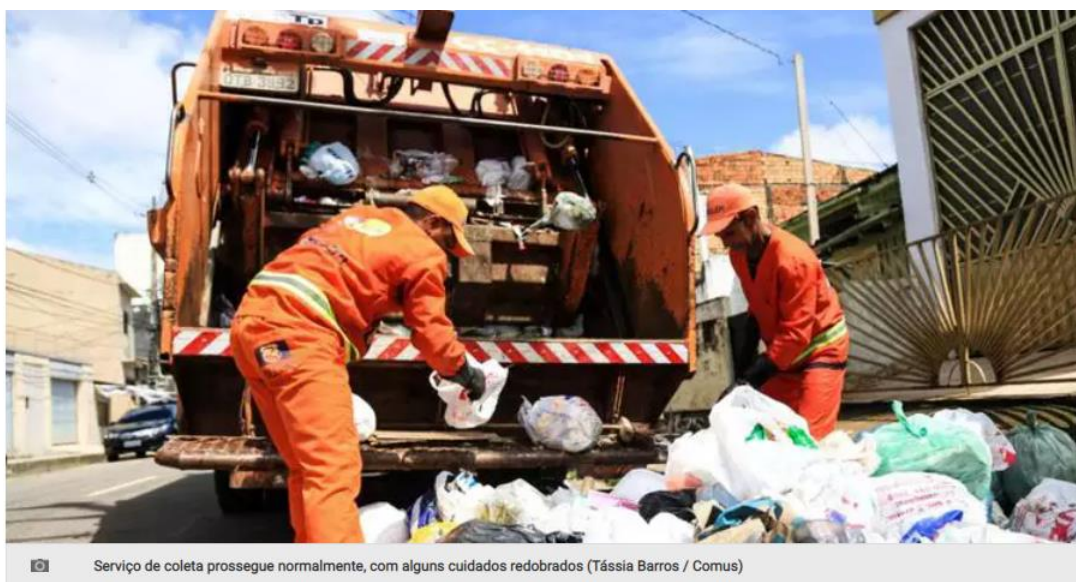
Serviço de coleta prossegue normalmente, com alguns cuidados redobrados

Para cobrar medidas efetivas sobre a destinação final dos resíduos sólidos , o Ministério Público do Estado do Pará (MPPA) expediu na quinta-feira (10) uma recomendação conjunta aos municípios de Belém , Ananindeua e ao Estado do Pará . Foi requerido o cumprimento das cláusulas do acordo firmado entre as partes em agosto de 2021, para a prorrogação do funcionamento do Aterro Sanitário de Marituba , que deve receber os resíduos desses municípios até 31 de agosto de 2023.