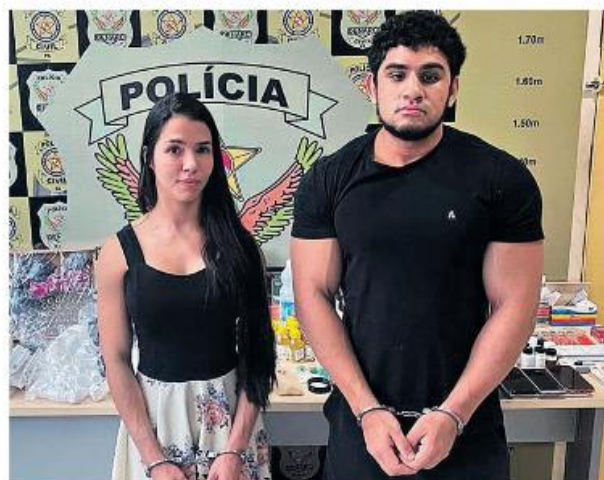
As investigações continuam, já que os policiais querem descobrir quem eram os clientes do casal

Foram apreendidos diversos esteroides, material entorpecente, recipientes para armazenamento de anabolizantes, celulares, dentre outros. As investigações continuam, a fim de identificar os demais integrantes desse núcleo criminoso, bem como os clientes do casal.