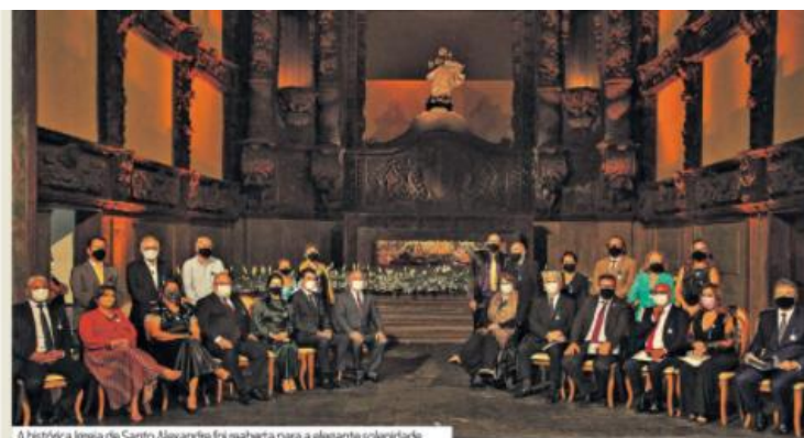
A histórica Igreja de Santo Alexandre foi resabeta para a elegante solenidade