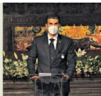
O governador Helder Barbalho falou em nome dos homenageados