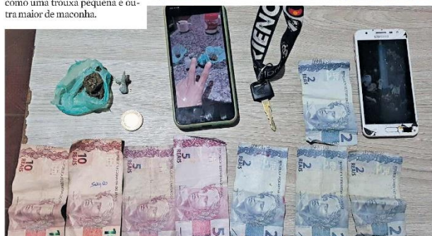
Os suspeitos foram presos no fim da noite de quinta com drogas que seriam comercializadas em Muaná

Além do material entorpecente foi encontrado com a dupla dinheiro em notas de R$10,00, R$5,00 e R$2,00 e uma moeda de R$1,00 que segundo a polícia o dinheiro facilita o troco naquela hora da noite. Os dois foram apresentados para o flagrante na delegacia de Polícia Civil de Muaná.