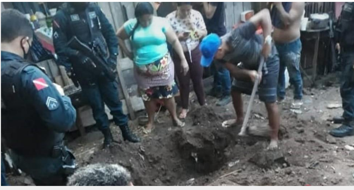
Cova onde estava enterrada doméstica em Ananindeua