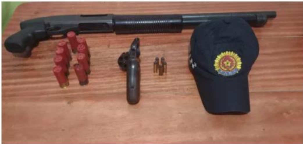
Homem é suspeito de participação em diversos crimes cometidos em Floresta do Araguaia.

Um homem foragido da Justiça do Pará foi preso na noite desta quinta-feira (6) no município de Floresta do Araguaia, sudeste paraense, por porte ilegal de arma de fogo. A prisão ocorreu durante abordagem feita pela Polícia Militar. Com ele foram encontradas duas armas de fogo e munições de vários calibres.