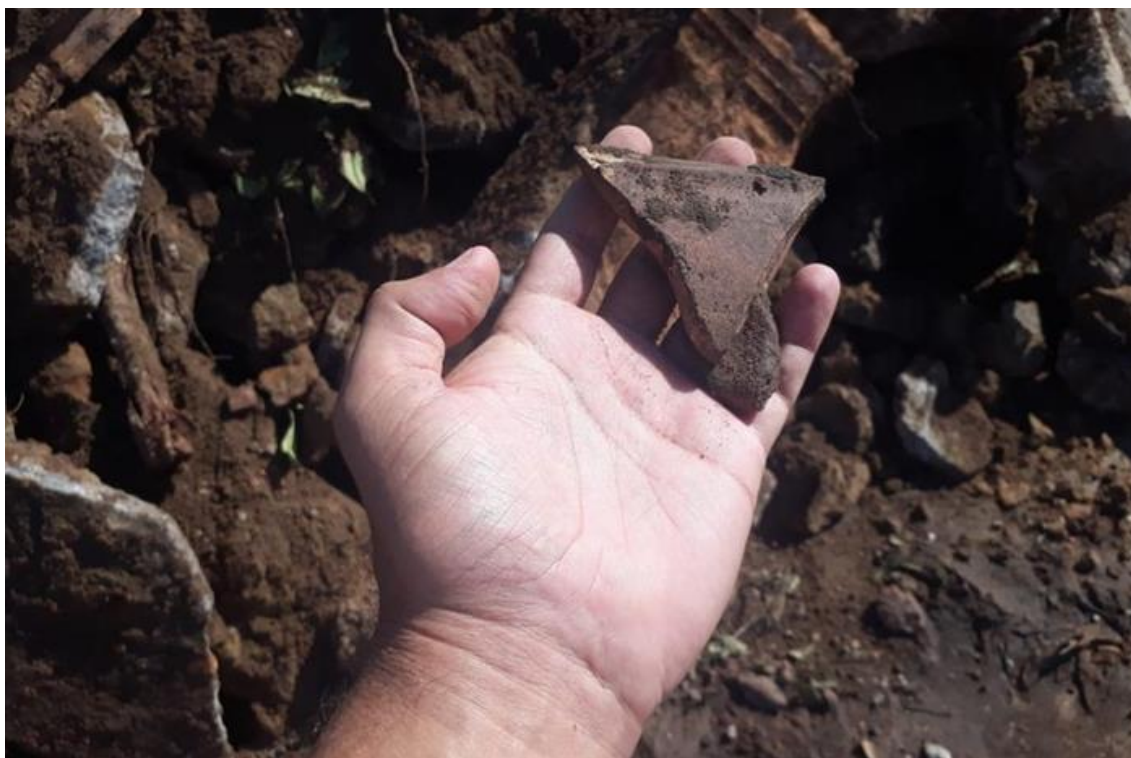
Fragmentos de cerâmica e ossos apareceram a aparecer no local da obra(Reprodução / Sidney Canto)

As obras do Camelódromo iniciaram na última terça-feira (4), com a retirada de algumas árvores do local. Com a continuidade dos serviços, fragmentos de cerâmica e ossos apareceram a aparecer, o que chamou a atenção para um possível sítio arqueológico naquele espaço.