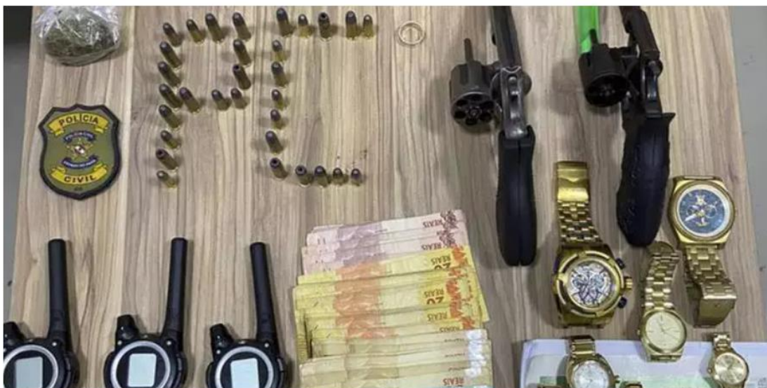
No imóvel, foram apreendidos entorpecentes, munições, armas de fogo, balança de precisão, vários celulares, rádios de comunicação, cadernos com anotações e uma quantia em dinheiro.

Quatro pessoas, sendo dois homens e duas mulheres, foram presas pela Polícia Civil, na última sexta-feira (10), em Parauapebas. As prisões temporárias são decorrentes de mandados judiciais referentes à investigação de um homicídio, ocorrido em uma vicinal sentido ao município de Canaã dos Carajás. As informações foram divulgadas pela PCPA na noite de sábado (11).