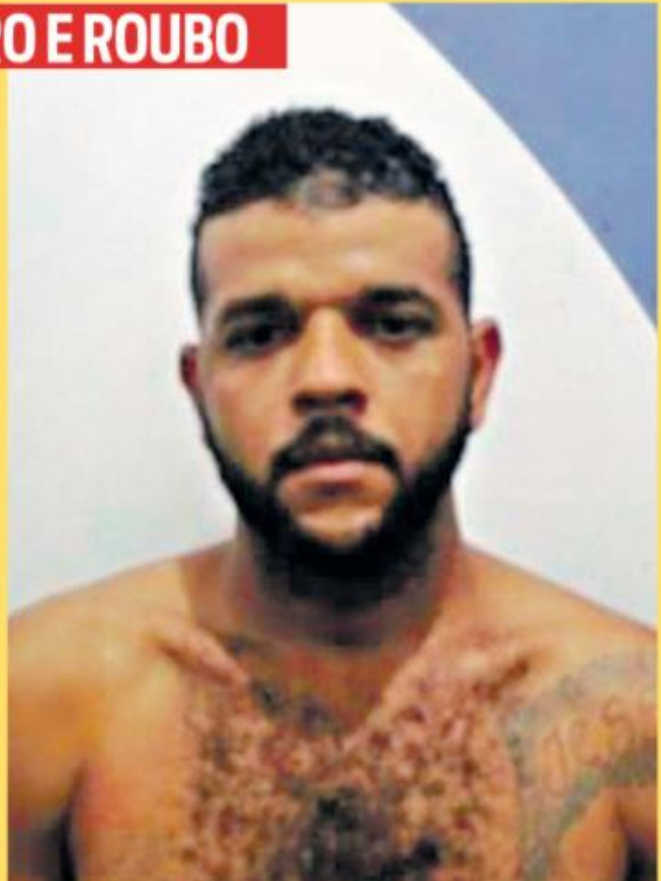
Elifan é considerado perigoso pela Polícia e tem passagem por crime de latrocínio registrado em Pernambuco

opiniao@diarioonline.com.br Você gostaria de comentar? www.diarioonline.com.br