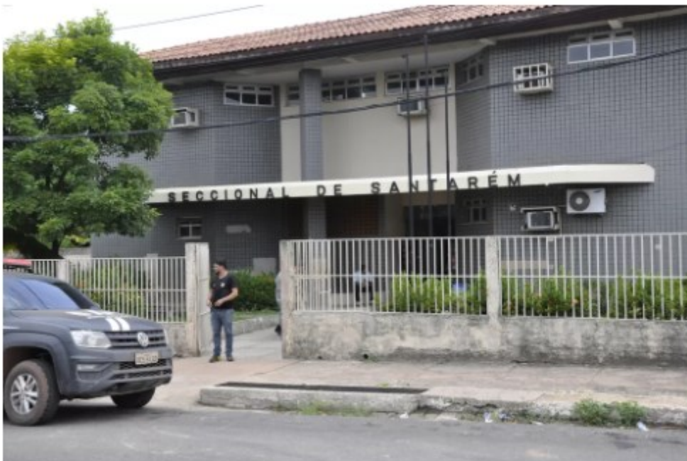
Liminar obriga Estado a adequar prédios da Polícia Civil em Santarém para garantir acessibilidade

Uma liminar judicial determina que o Estado faça adaptações e reforma relacionada à acessibilidade nos prédios da Superintendência Regional, 16ª Seccional Urbana e da Identificação Regional, no bairro Santa Clara, em Santarém. A decisão é em resposta à ação da Promotoria de Justiça e saiu no dia 8 de novembro.