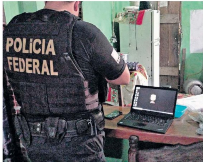
A operação cumpriu mandado de busca e apreensão na cidade de Nova Timboteua

Com as ações de hoje, no combate à exploração sexual infantil, a Polícia Federal, somente no ano de 2021, cumpriu quinze mandados de busca e apreensão nas cidades de Nova Timboteua, Marituba, Baião, Moju, Vigia, Ananindeua, Abaetetuba, São Francisco do Pará e Belém, sendo dez mandados de quebra de dados telemáticos, duas prisões em flagrante e uma prisão preventiva, além da identificação e resgate de quatro vítimas vulneráveis abusadas sexualmente. Na Operação realizada no dia de hoje, não foi efetuada nenhuma prisão em flagrante.