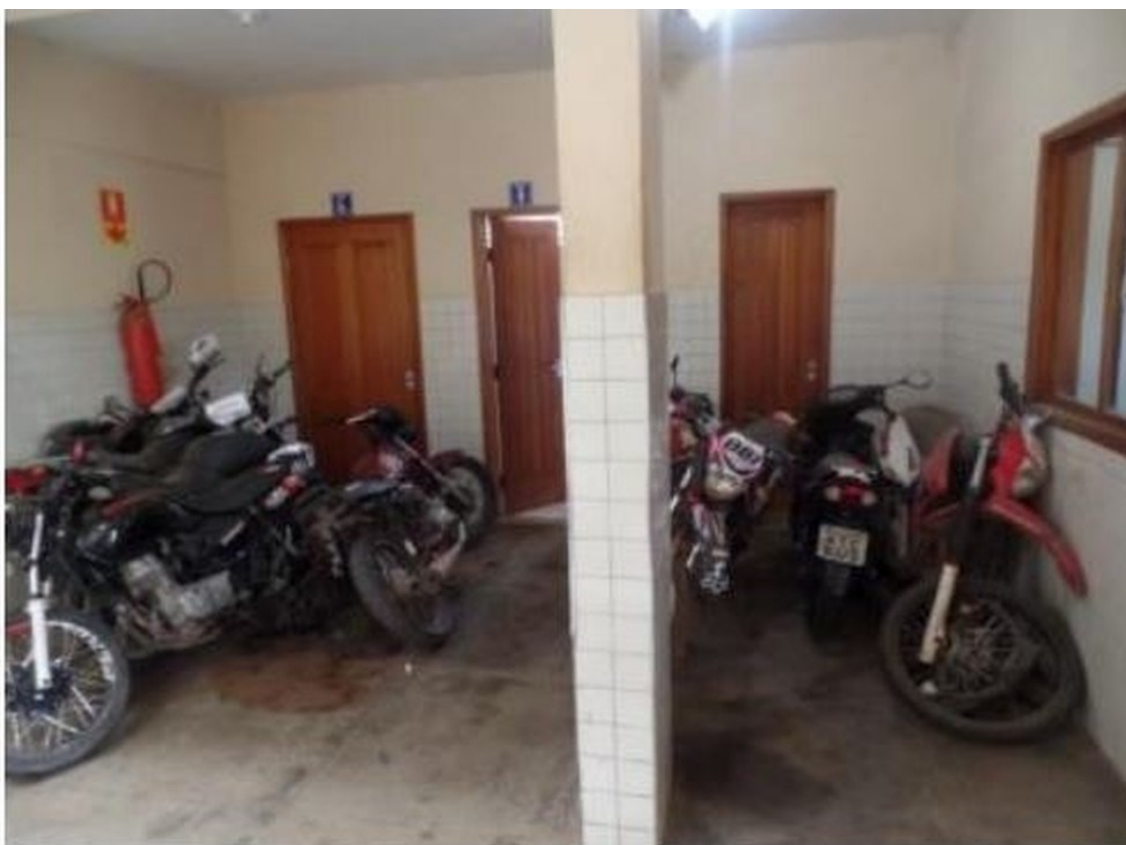
Motos dentro da Seccional atrapalham o trânsito de pessoas no prédio

A primeira inspeção nos prédios foi em junho de 2016, quando foi constatado que as instalações não atendiam às normas de acessibilidade. Foi instaurado inquérito civil para adotar medidas para garantir a acessibilidade às pessoas com deficiência e/ou mobilidade.