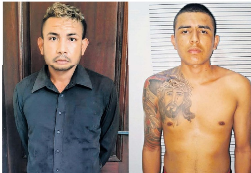
Dois suspeitos foram em cana no Marajó em situações diferentes

A guarnição do sargento Iokanam, soldados Souza e Rocha do 82º Pelotão Policial Destacado do município de Curralinho, na ilha do Marajó, fizeram a deten-