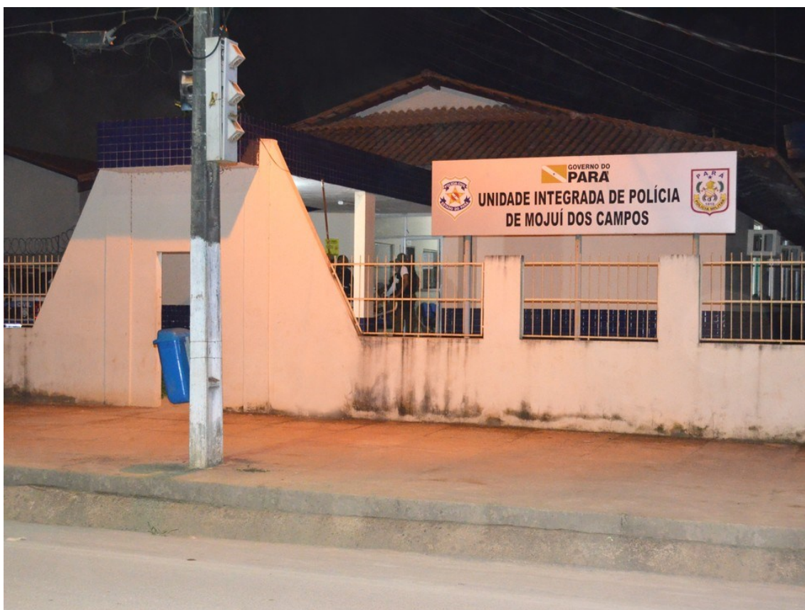
UIP de Mojuí dos Campos, no PA

Um homem foi preso na manhã desta sexta-feira (19) no município de Mojuí dos Campos, no oeste do Pará, em cumprimento a um mandado de prisão temporária por um assassinato ocorrido no dia 15 de agosto de 2021 após um desentendimento em frente ao Campo do Nogueirão.